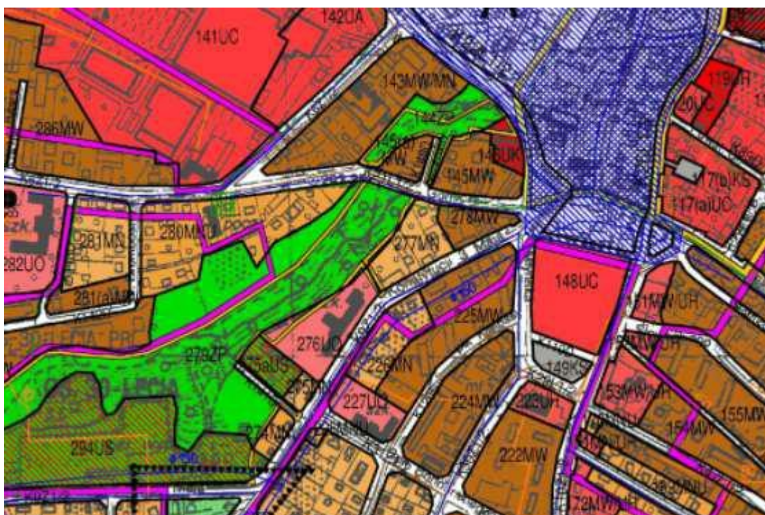
Rys.2 Fragment załącznika graficznego do MPZP dla przedmiotowej lokalizacji

Zakres planowanej inwestycji nie jest ograniczony przez zapisy szczegółowe w Miejscowym Planie Zagospodarowania Przestrzennego dla przedmiotowej działki.