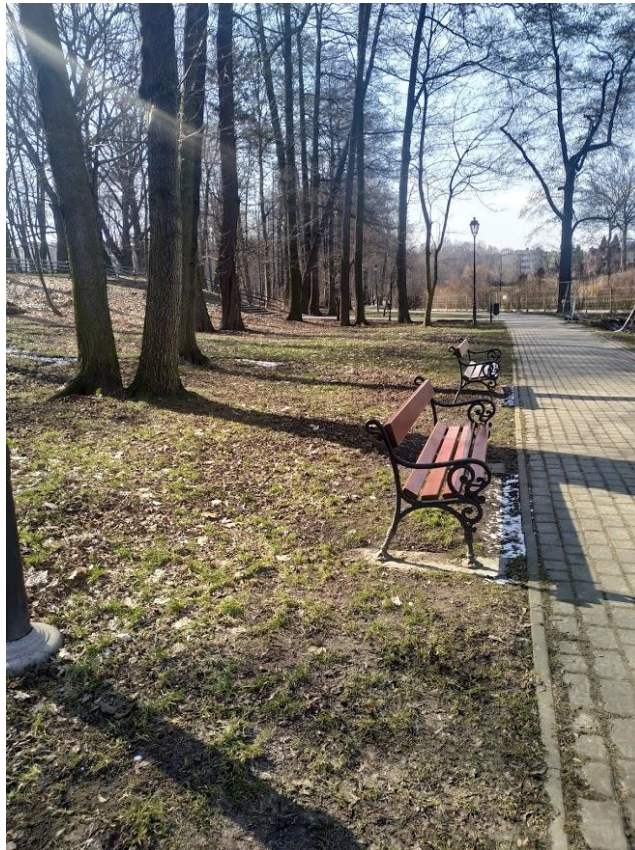
Fot. 3 Główna aleja