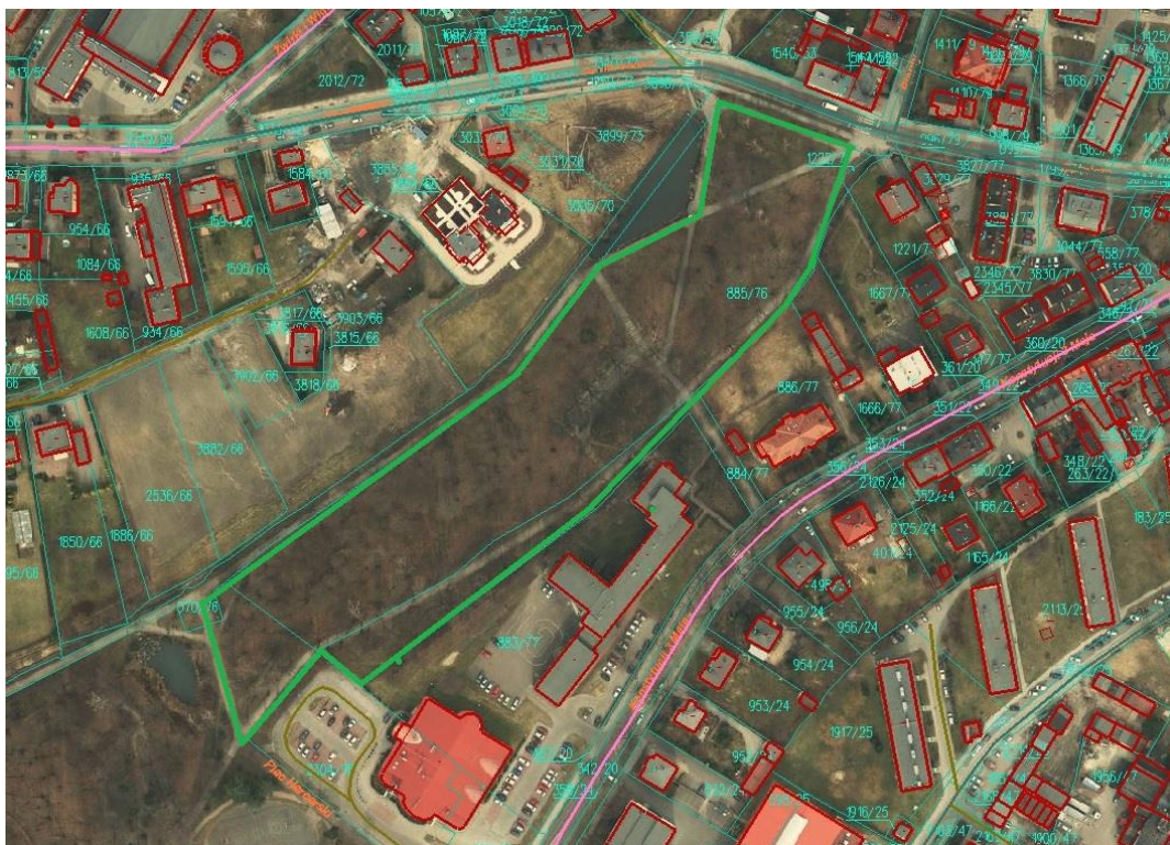
Rys.1 Zakres opracowania