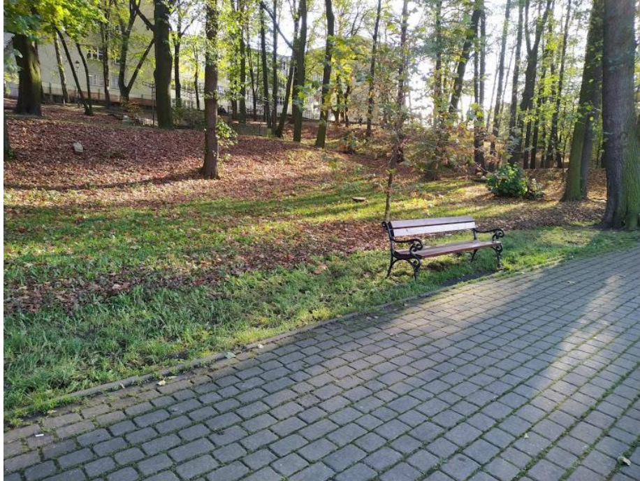
Fot. 1 Ławka przy głównej alei parku

Poniżej przedstawiono dokumentację fotograficzną dla terenu parku przeznaczonego pod obsadę: