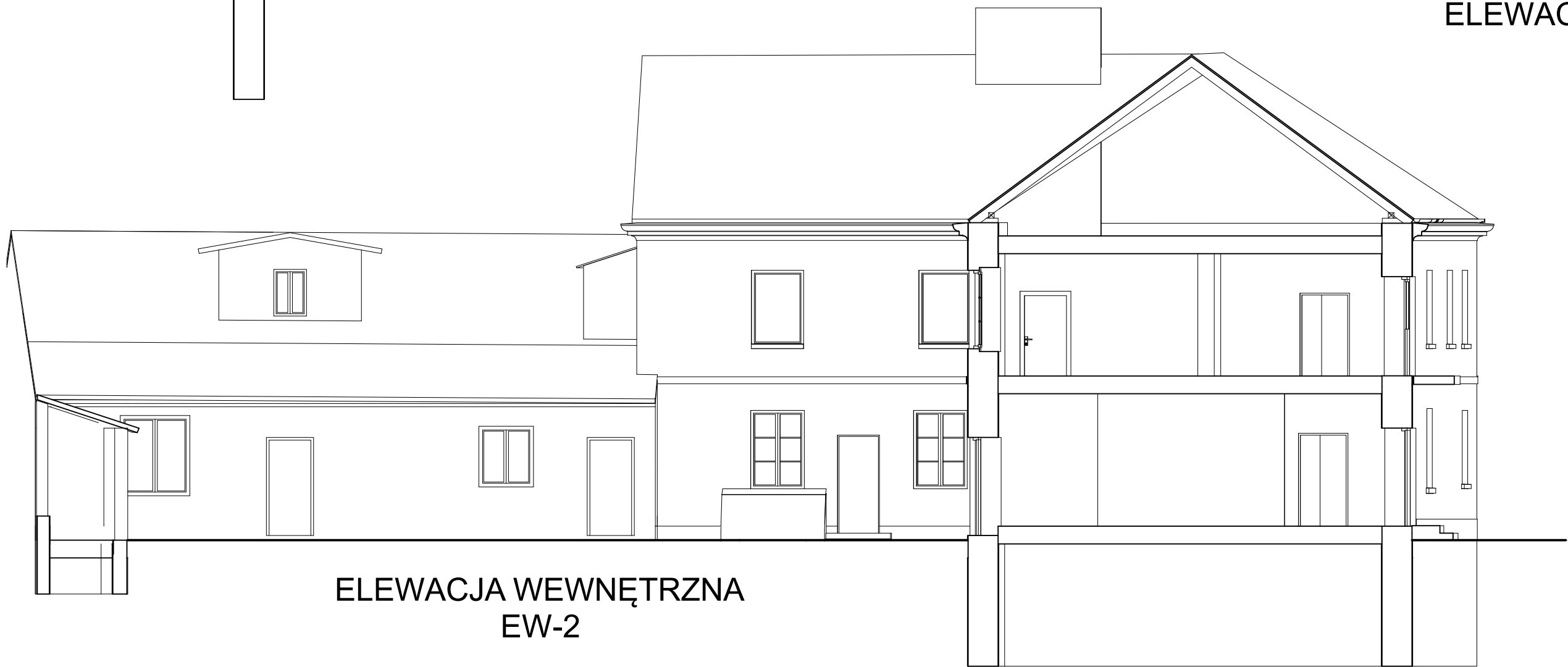
ELEWACJA WEWNĘTRZNA EW-2