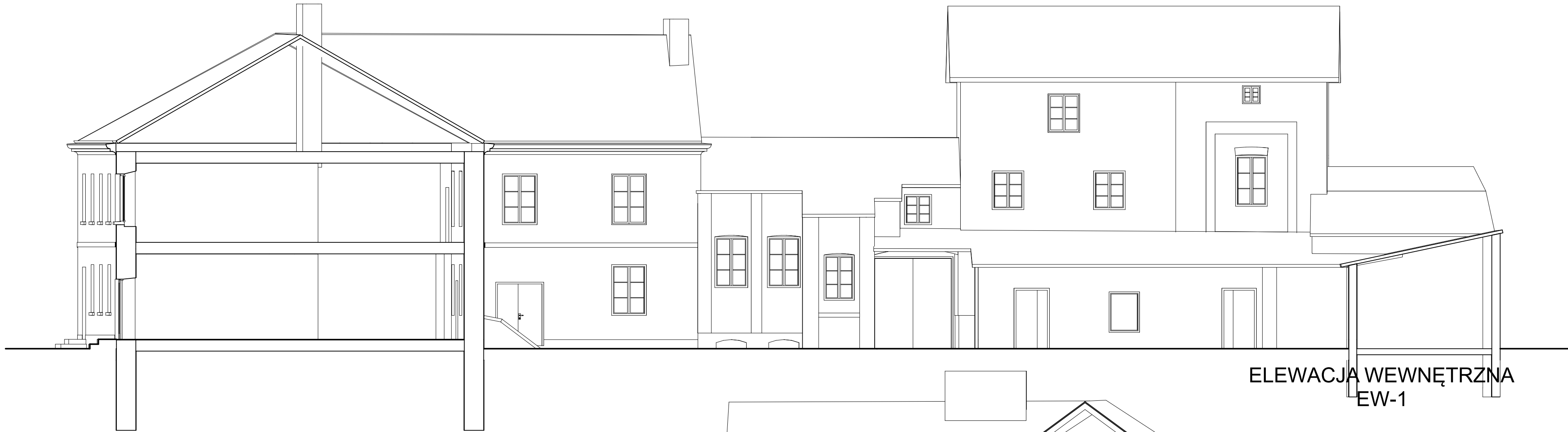
ELEWACJA WEWNĘTRZNA EW-1