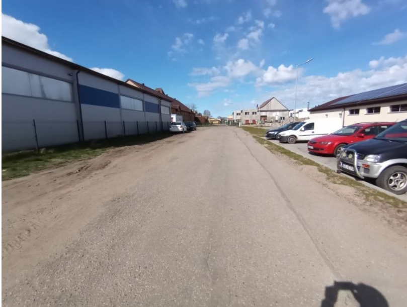
Fot. Droga wewnętrzna