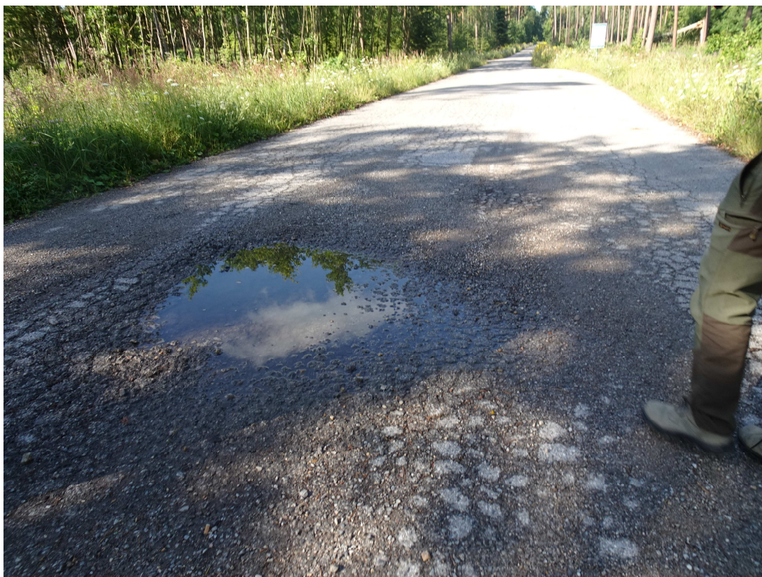
3. Widok pojedynczego wyboju