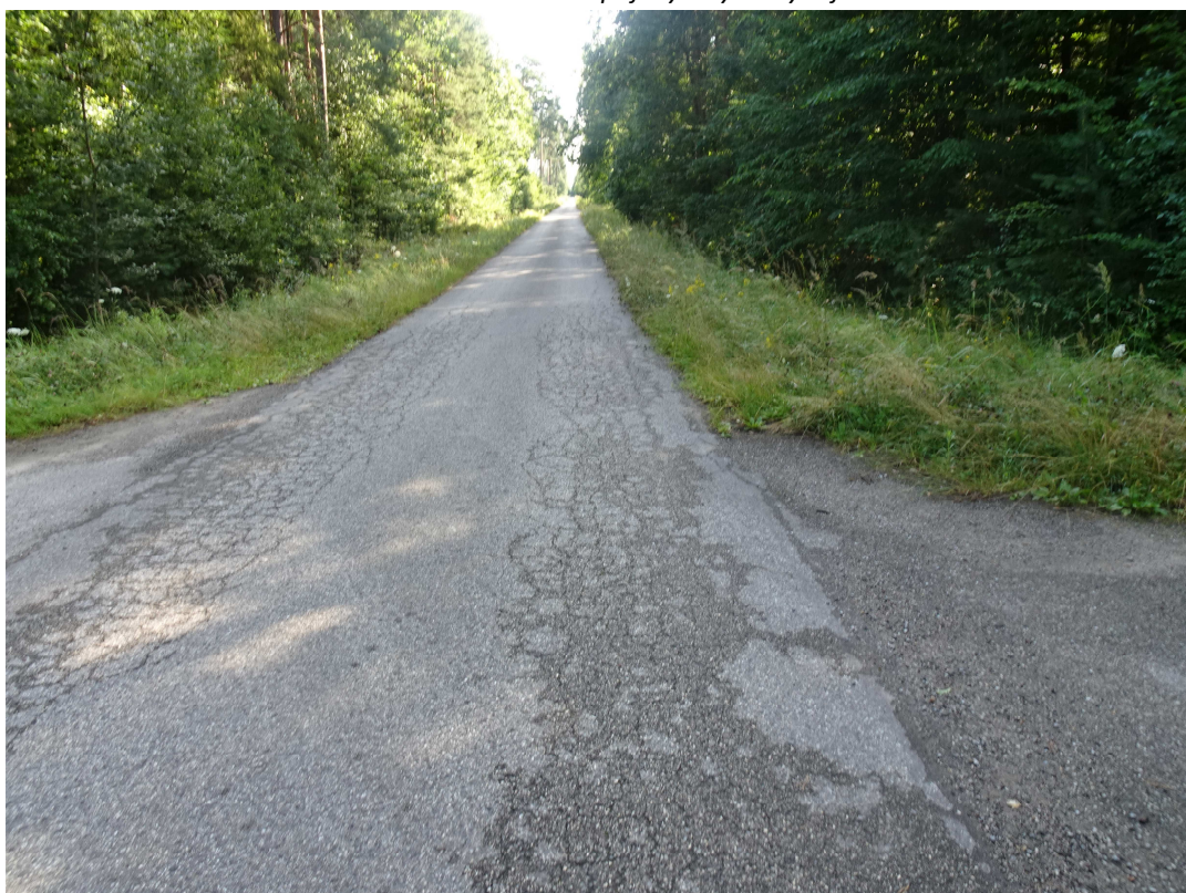
2. Widok kolein i spękań siatkowych w śladzie kół