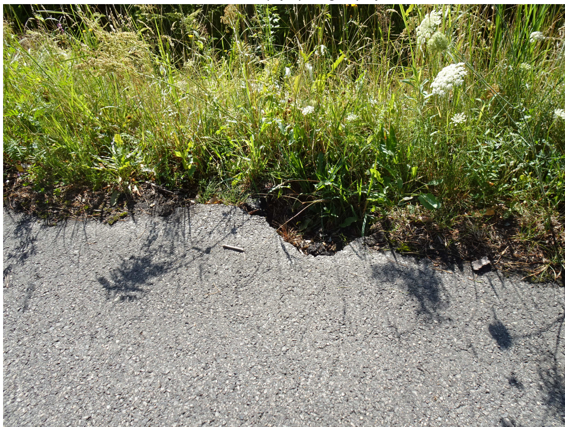
4. Widok wykruszenia (ubytku) oraz ubytku pobocza