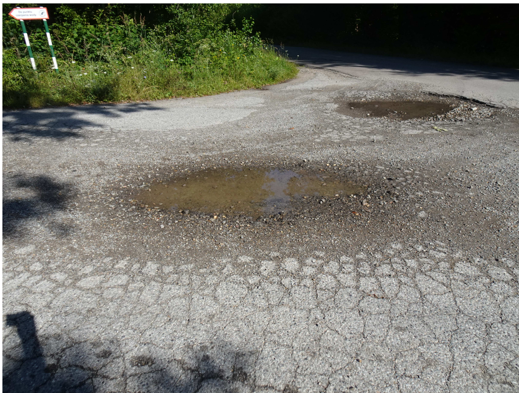
1. Widok pojedynczych wybojów

Dokumentacja fotograficzna uszkodzeń sporządzona została na podstawie zdjęć wykonanych podczas wizji w terenie.