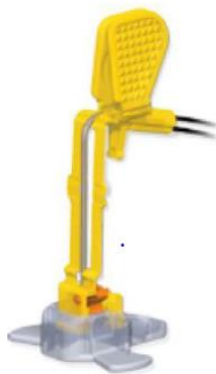
Ryc 2. Igła ze skrzydełkam

Odpowiedź: Zamawiający oczekuje miękkiej poduszki i odpinanych skrzydełek, zgodnie z zapisami SWZ.