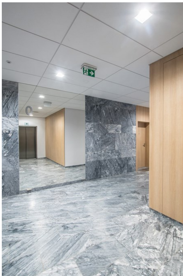
"Nova Królikarnia" osiedle, Warszawa

Korpus oprawy wykonany z odlewu aluminiowego. Technologia ta zdecydowanie zwiększa możliwości zastosowania danej oprawy ze względu na mniejsze obciążenie sufitów, ponieważ nie jest wymagany dodatkowy radiator chłodzący. Oprawa posiada możliwość regulacji optyki w dwóch płaszczyznach (w osi pionowej o 359° oraz w lewo i w prawo po 15°). Oprawy te stosowane są do oświetlenia wnętrz o znaczeniu prestiżowym, takich jak: hotele, banki, biura o podwyższonym standardzie. Dzięki zastosowaniu najnowszych komponentów oraz ledów renomowanych firm możliwe stało się zbudowanie takich opraw oświetleniowych, które przynoszą znaczące oszczędności w zużyciu energii elektrycznej w porównaniu do tradycyjnych rozwiązań. Uwaga: kolor ramki i obudowy ma nieznacząco inny odcień niż wewnętrzna osłona odbłyśnika.