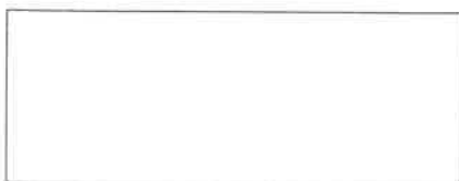
Pieczęć firmowa Wykonawcy