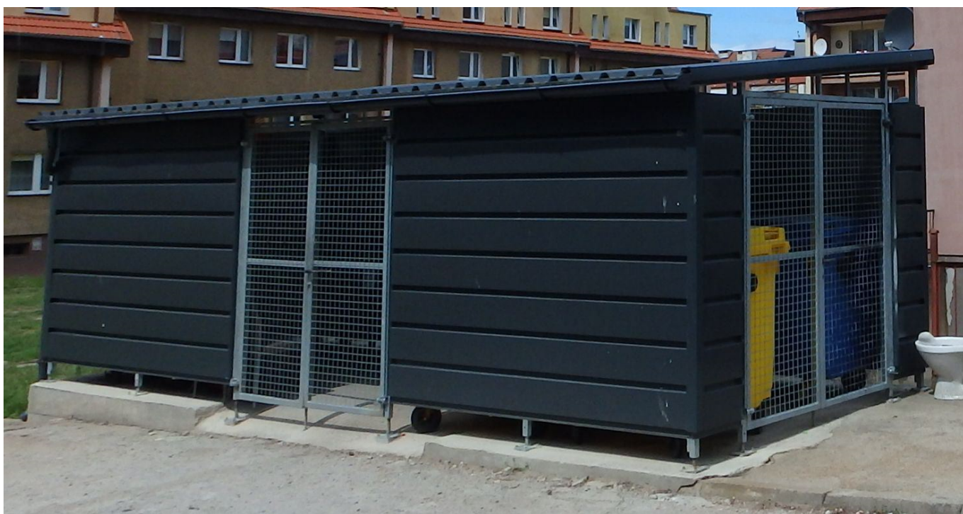
ISTNIEJĄCA WIATA ŚMIETNIKOWA