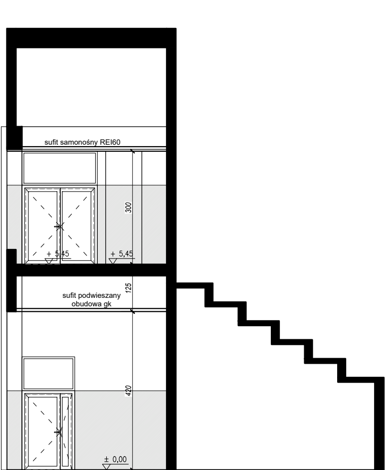
KLATKA SCHODOWA KL 1