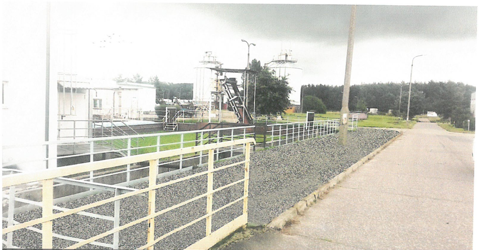
Wizualizacja nr 2 - widok na pas nawierzchni żwirowej przy budynku krat.