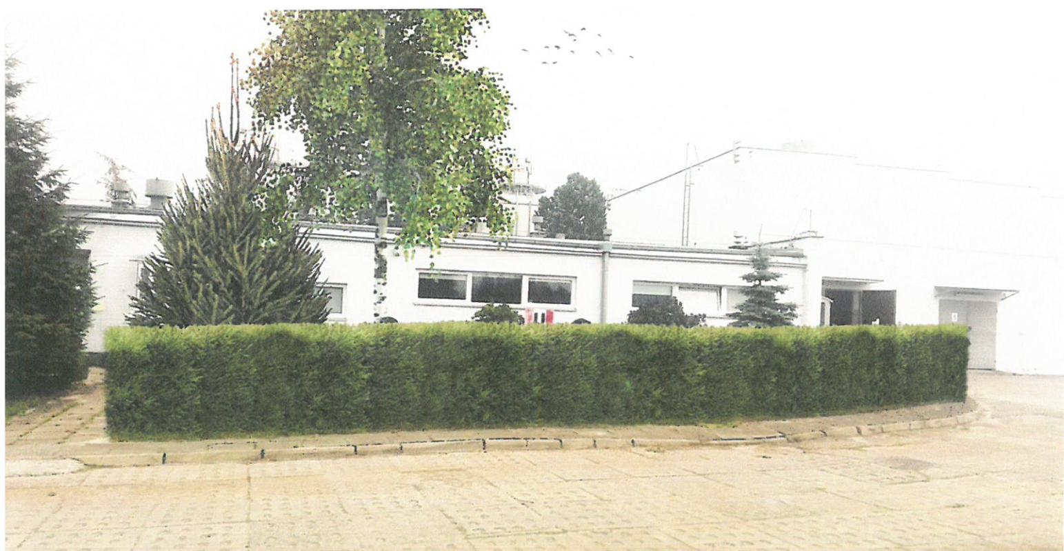
Wizualizacja nr 6 - widok na budynek mistrzów z nasadzeniami w postaci świerku, brzozy oraz świerkowego żywopłotu.