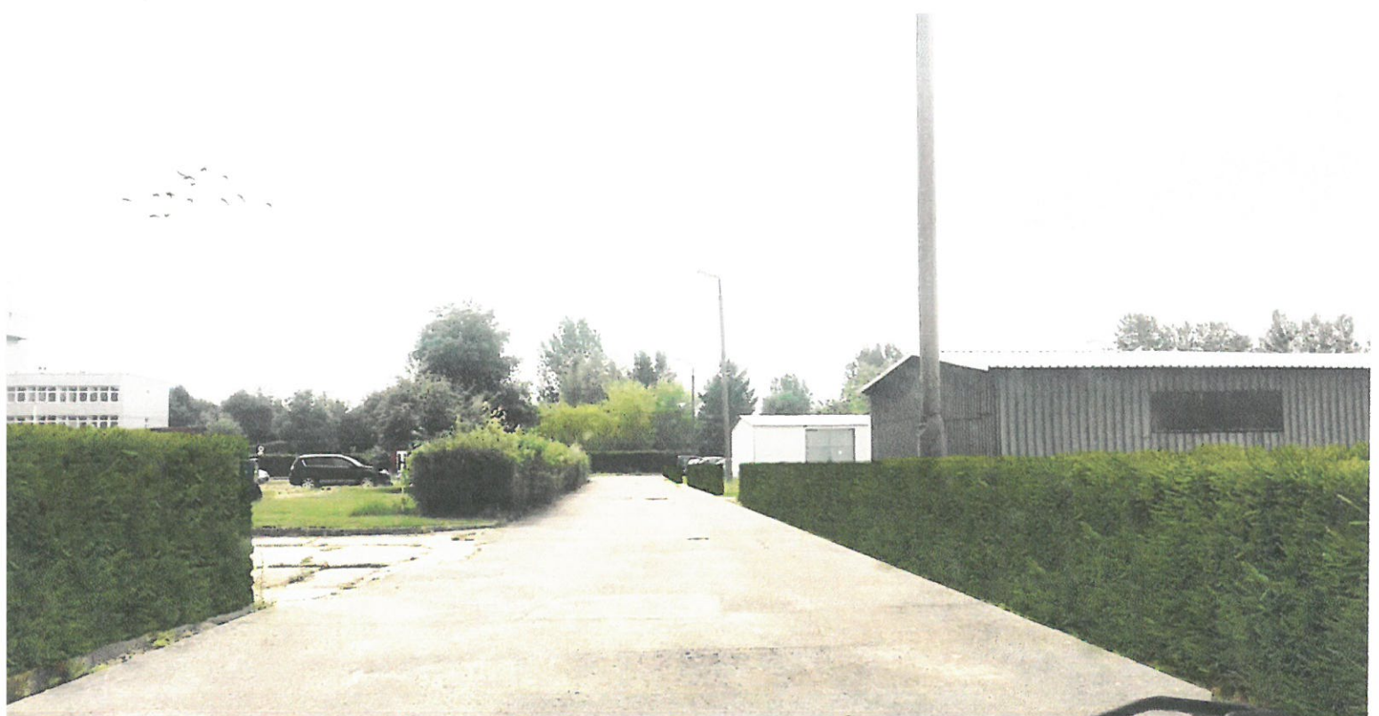
Wizualizacja nr 12 - widok na budynki gospodarcze zasłonięte żywopłotem świerkowym.