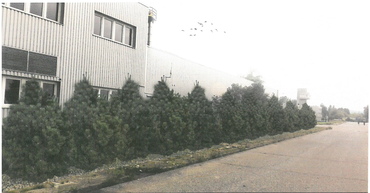
Wizualizacja nr 4 - widok przy kotłowni gazowo-olejowej. Nasadzenia z sosny czarnej w odmianie 'Nana'.