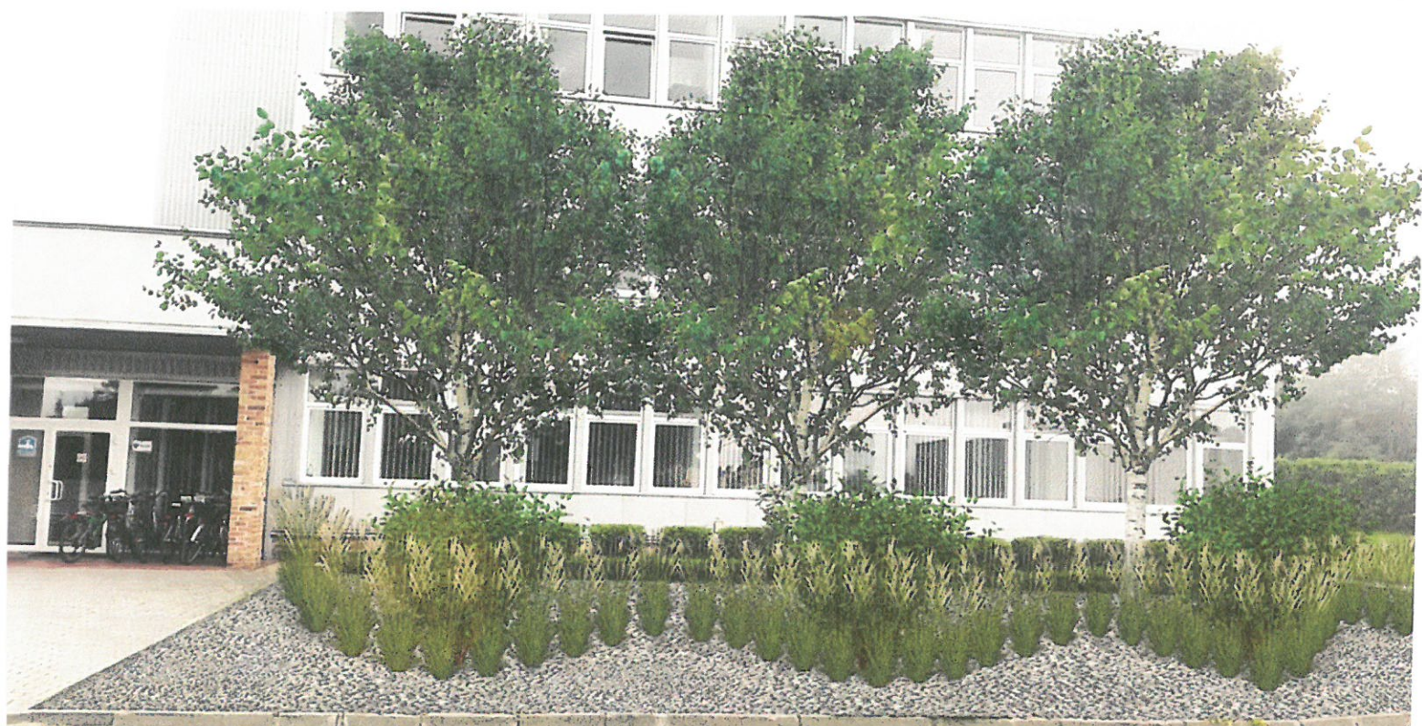
Wizualizacja nr 1 - widok na budynek administracyjny. Rabata z brzożami pożytecznymi, trawami ozdobnymi i krzewami.