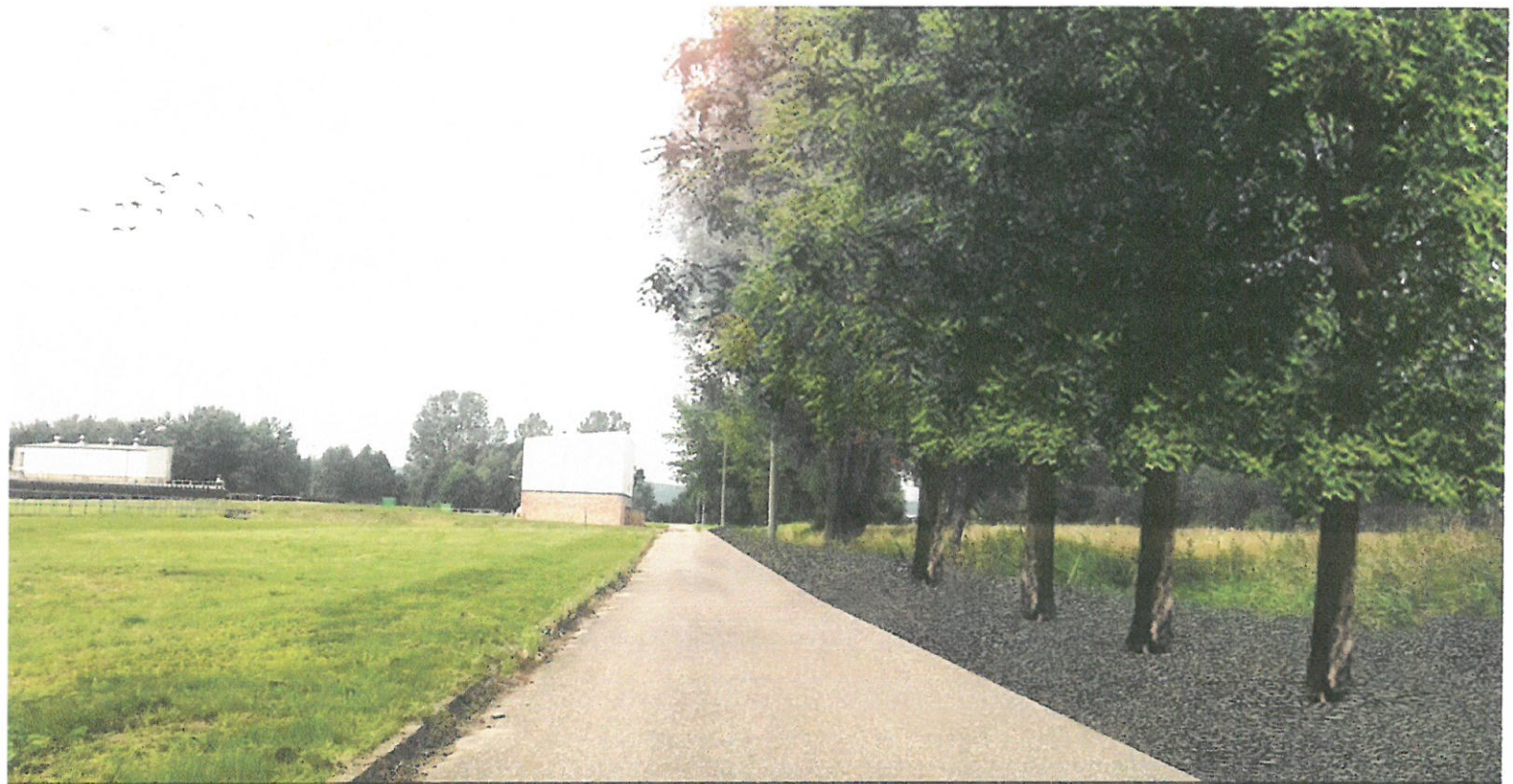
Wizualizacja nr 11 - widok w pobliżu osadników wtórnych z pasem zieleni w postaci wysokich drzew - klonów.