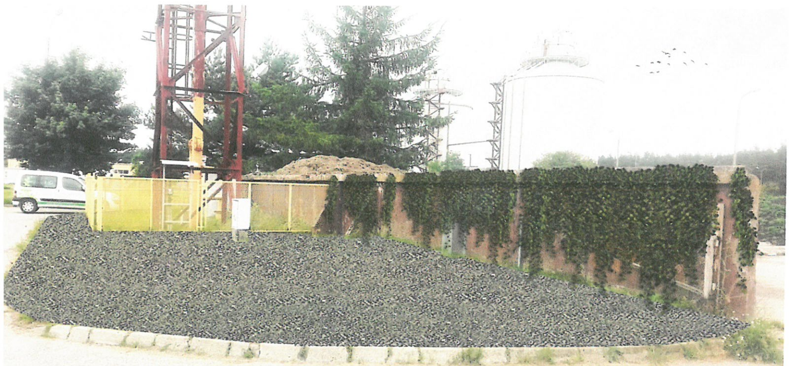
Wizualizacja nr 8 - widok na składowisko skratek i piasku. Zastąpienie trawnika nawierzchnią żwirową. Ostonięcie murów roślinnością pnącą.