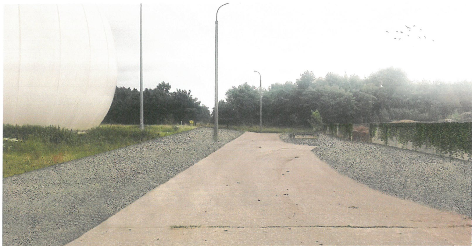
Wizualizacja nr 3 - widok na nawierzchnie żwirowe przy zbiorniku gazu.