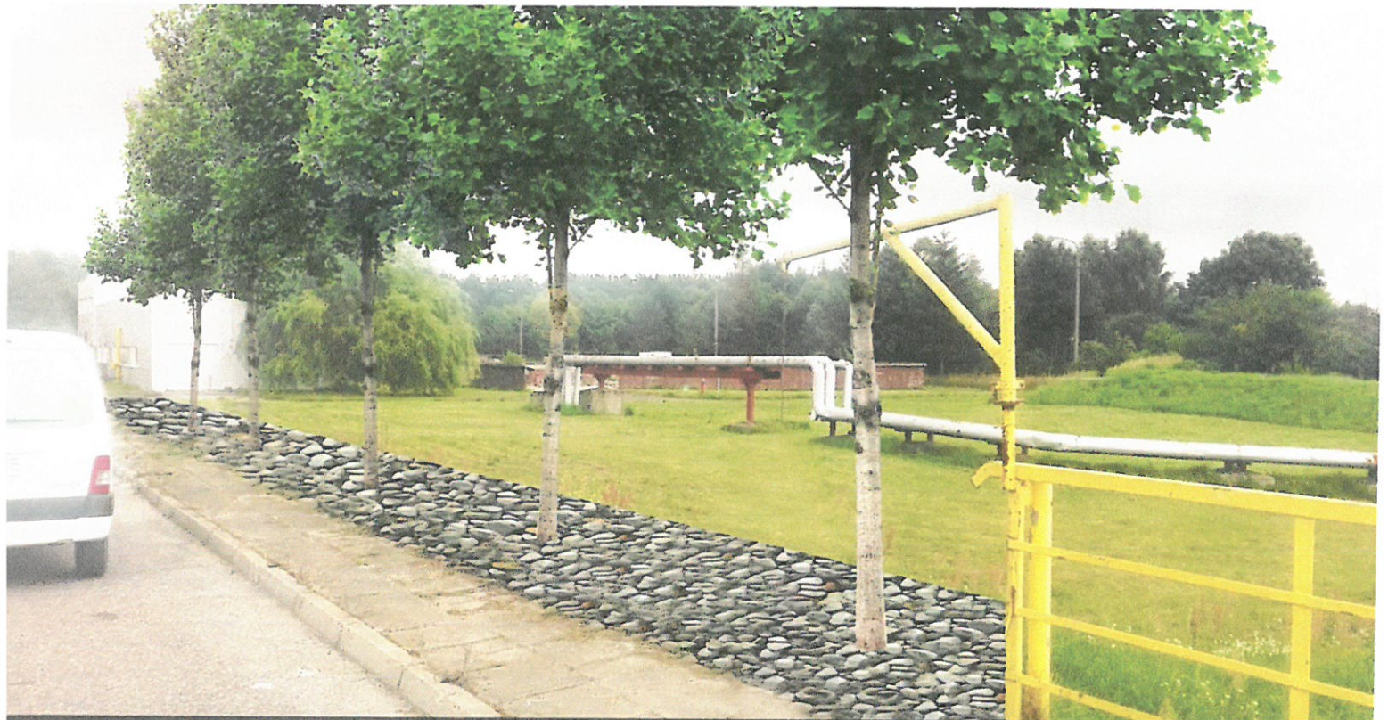
Wizualizacja nr 7 - widok w pobliżu komory zbiorczej. Aranzacja w postaci drzew oraz nawierzchni żwirowej.