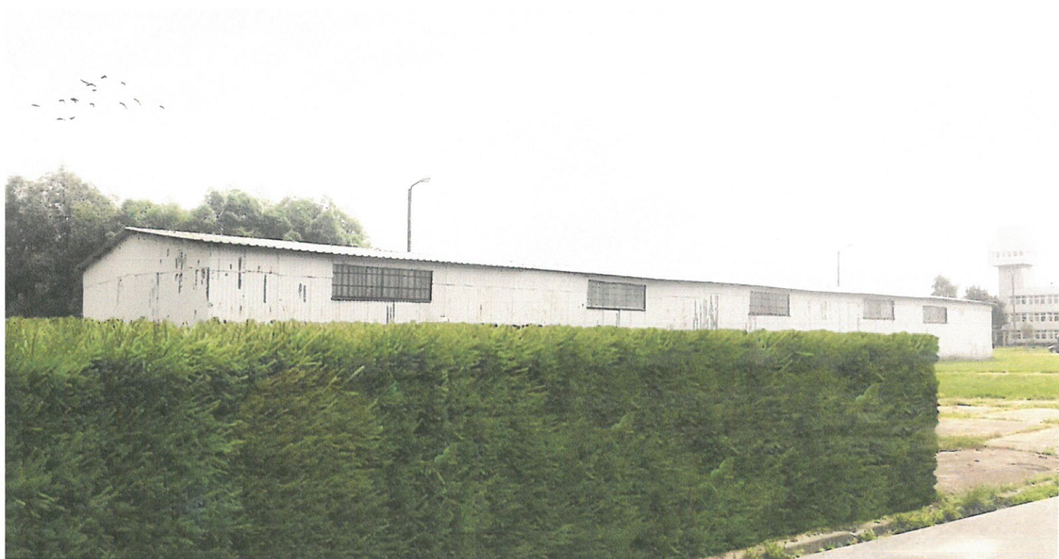
Wizualizacja nr 10 - zastąpienie budynków gospodarczych żywopłotem świerkowym.