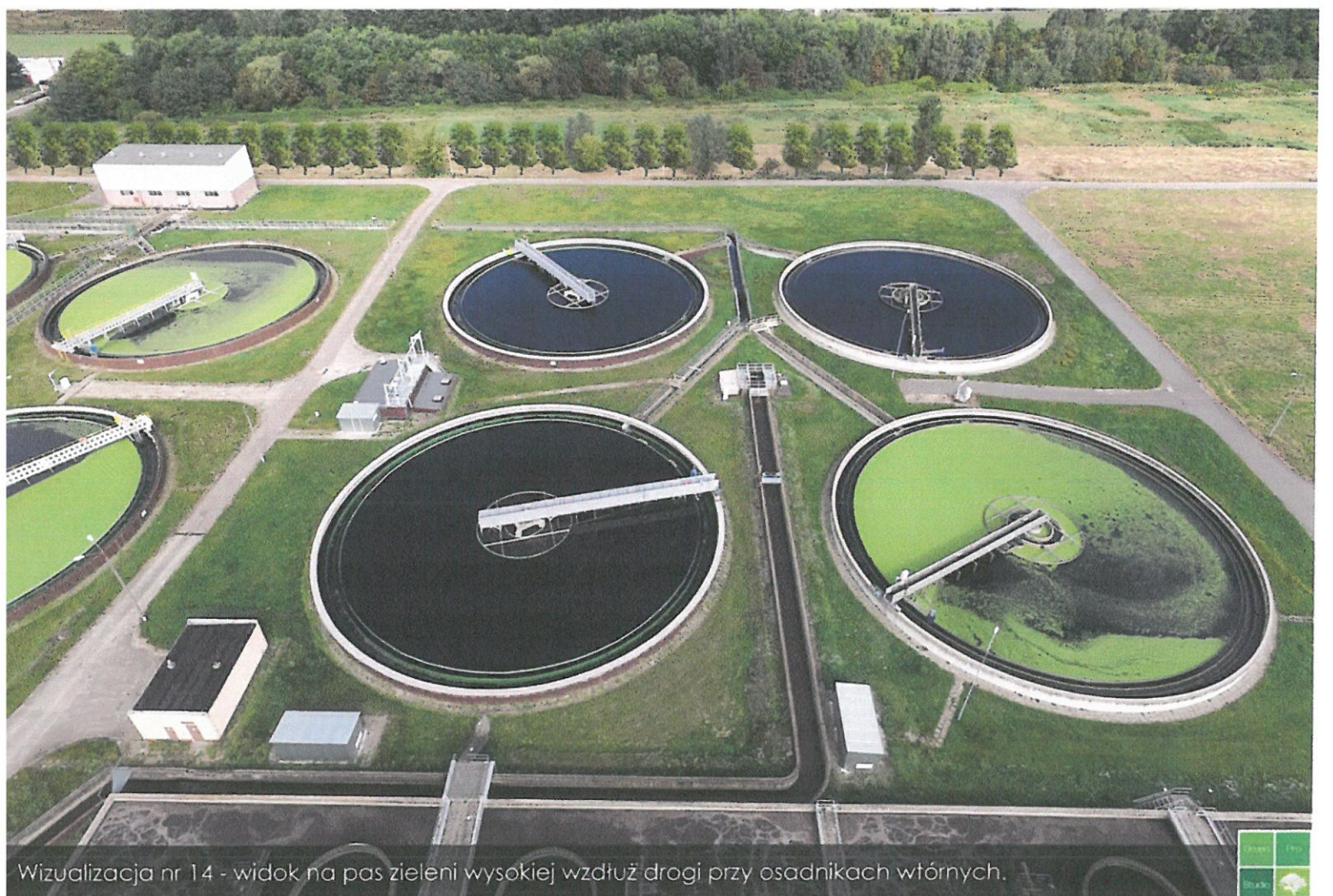
Wizualizacja nr 14 - widok na pas zieleni wysokiej wzdłuż drogi przy osadnikach wtórnych.