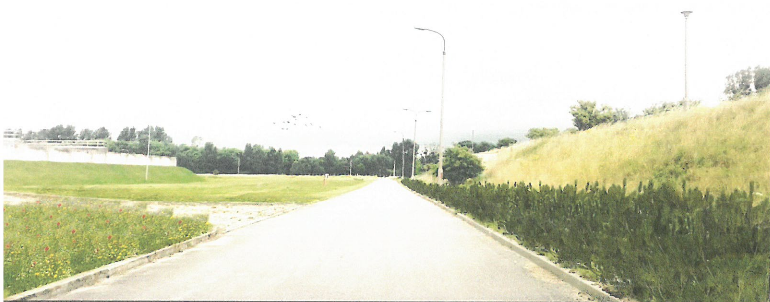
Wizualizacja nr 9 - widok pomiędzy otwartymi basenami fermentacyjnymi, a reaktorami biologicznymi. Po prawej stronie aranżacja z sosny czarnej w odmianie 'Nana'.