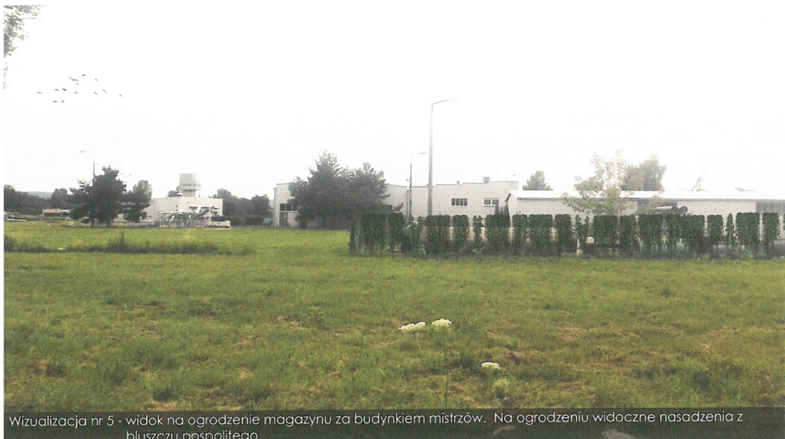
Wizualizacja nr 5 - widok na ogrodzenie magazynu za budynkiem mistrzów. Na ogrodzeniu widoczne nasadzenia z bluszczu pospolitego.