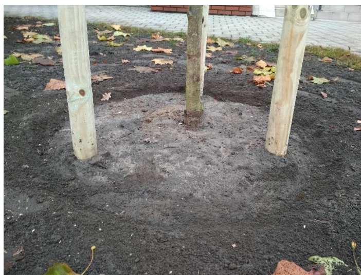
Ryc. 1 - Przykładowa misa do podlewania drzew.