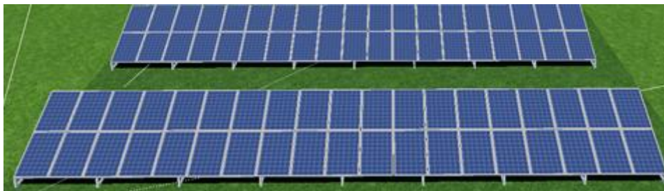
Rys. 1 Wizualizacja naziemnej instalacji fotowoltaicznej

Pomiary muszą zostać udokumentowane wydrukiem z przyrządu pomiarowego