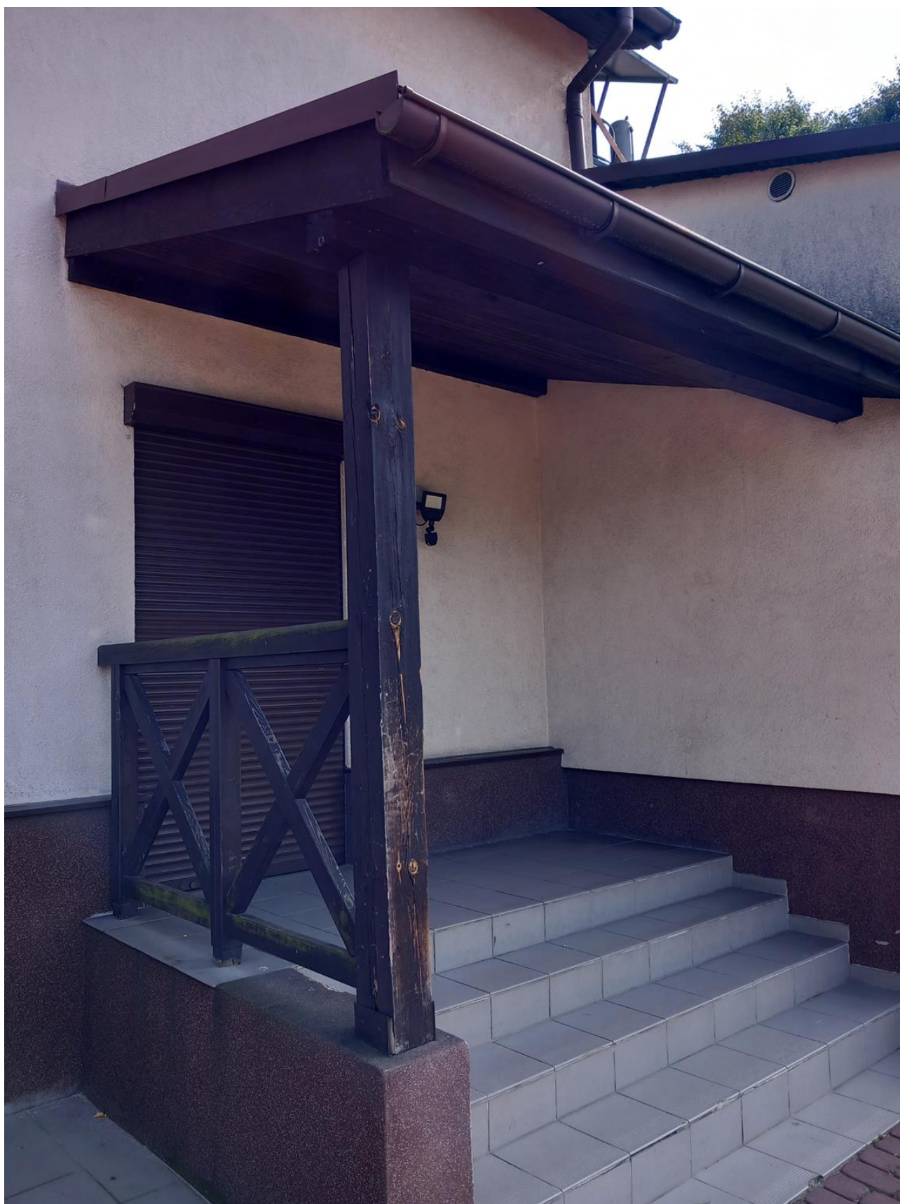
Zdjęcie nr 6. Słup drewniany do wymiany. Balustrada drewniana do odtworzenia i wymiany. Płytki na schodach i spoczniku do wymiany.