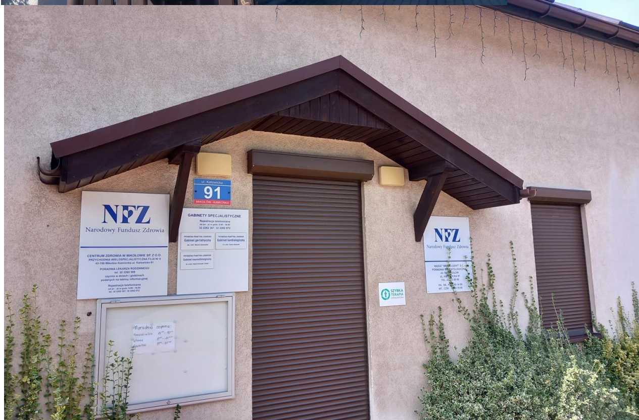
Zdjęcie nr 3, Elewacja do remontu/malowania