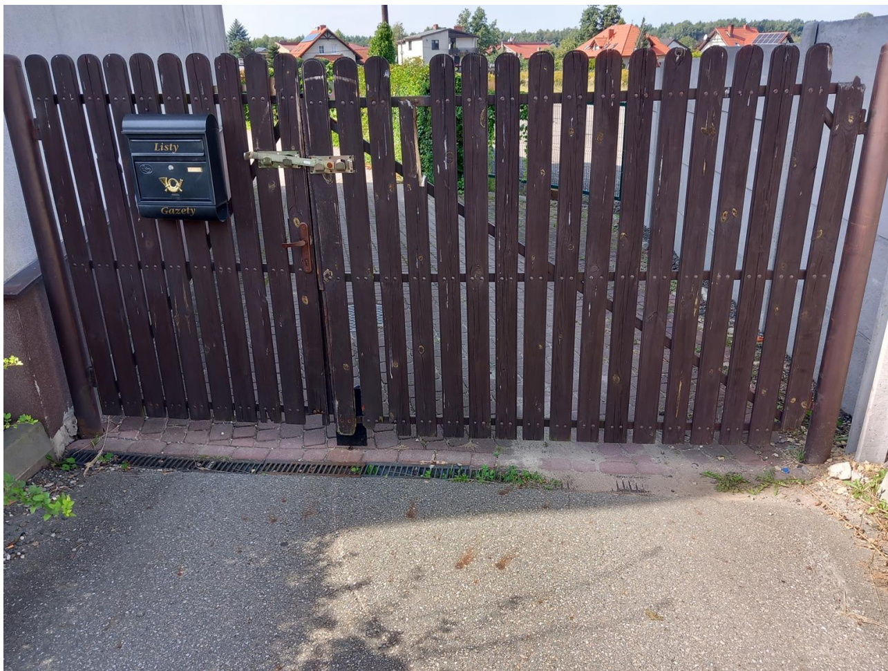
Zdjęcie nr 8. Wymiana 17 szt sztachet drewnianych. Malowanie konstrukcji bramy. Regulacja i wymiana okuć (klamka, zamek, rygiel bramy)