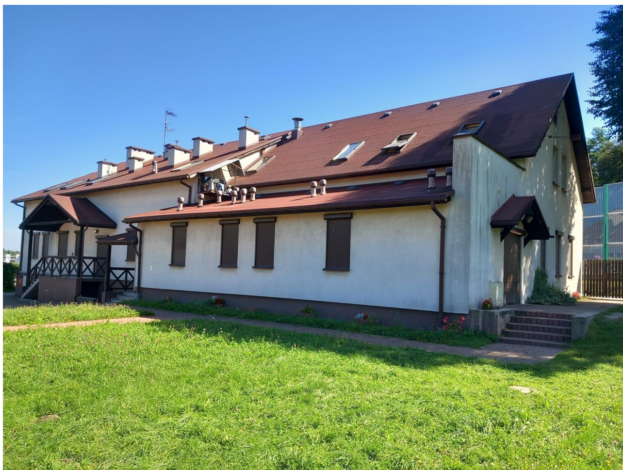
Zdjęcie nr 1. Elewacja zachodnia oraz ściana szczytowa do remontu/malowania