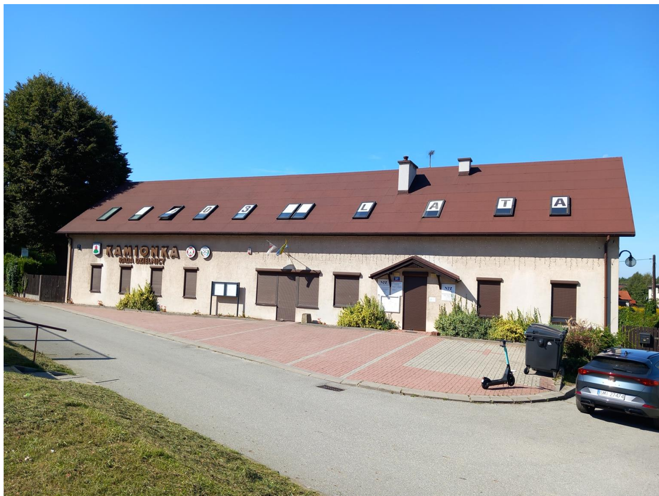
Zdjęcie nr 2. Elewacja do remontu/malowania