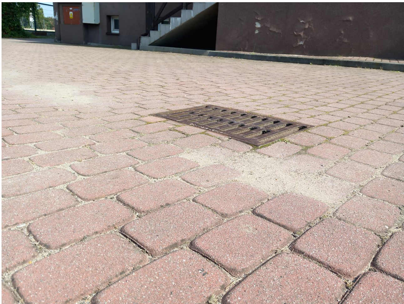
Zdjęcie nr 5. Wpust drogowy do obniżenia.