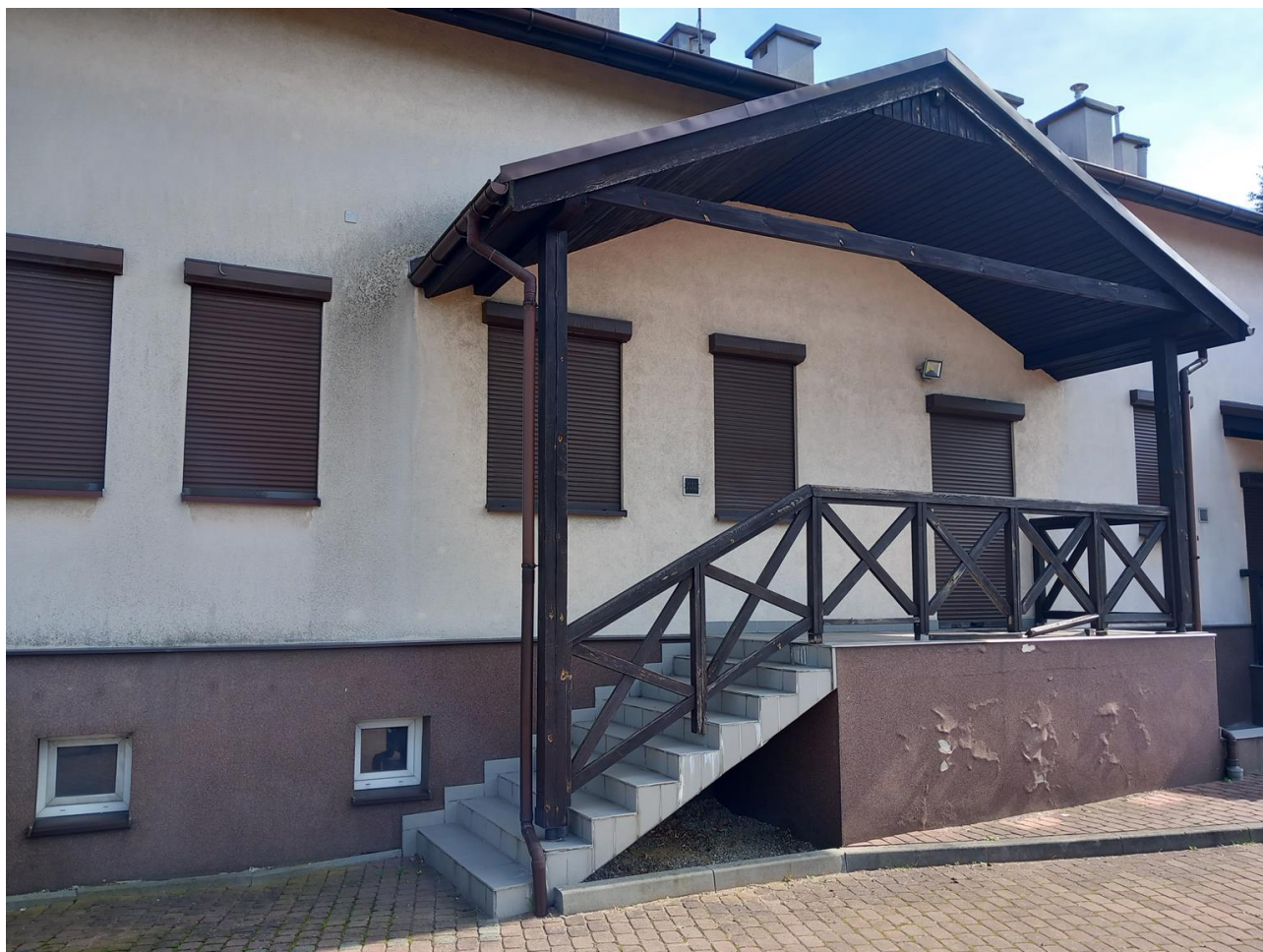
Zdjęcie nr 7. Balustrada drewniana do odtworzenia i wymiany. Elementy drewniane do impregnacji. Płytki w biegu schodowym do wymiany.