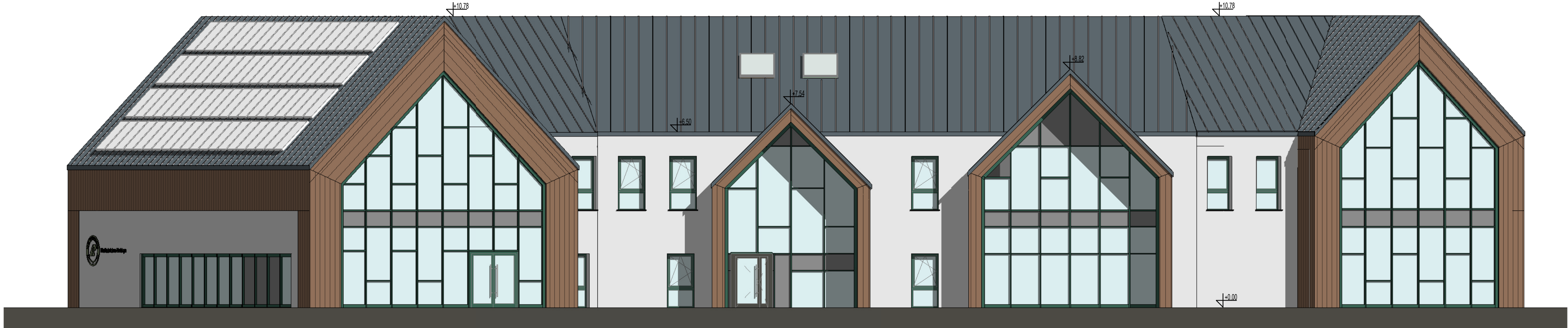
3 A - Elewacja wschodnia 1 : 100