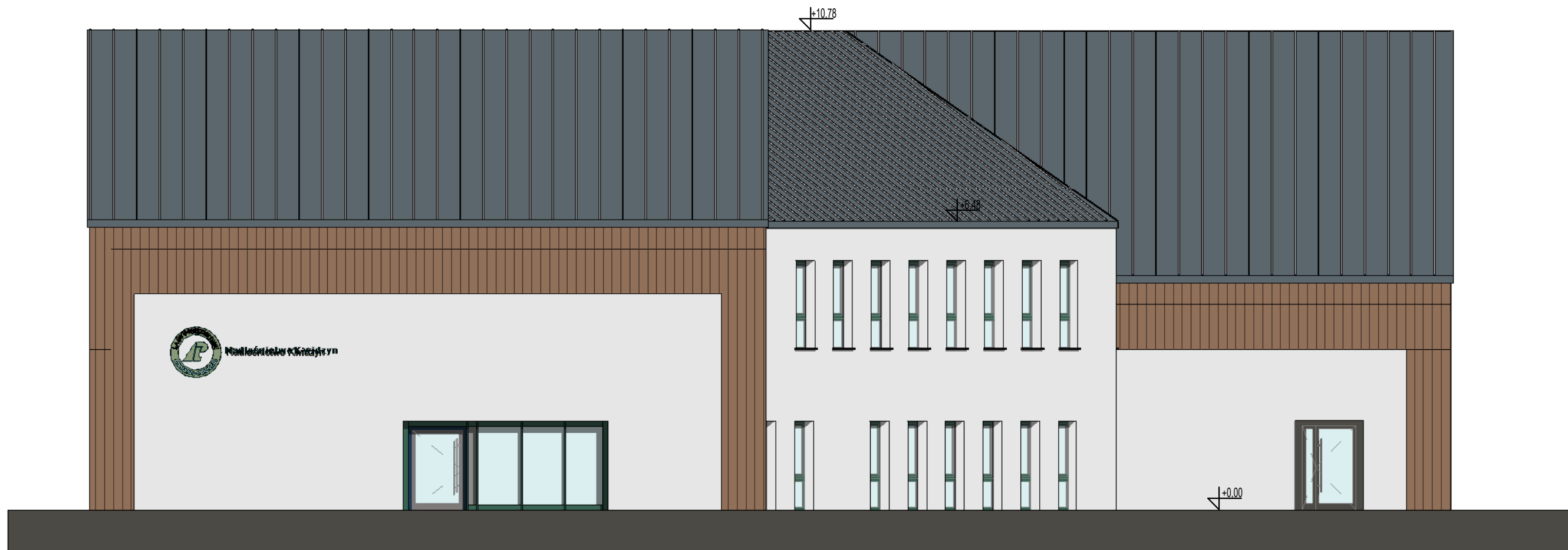
2 A - Elewacja północna 1 : 100