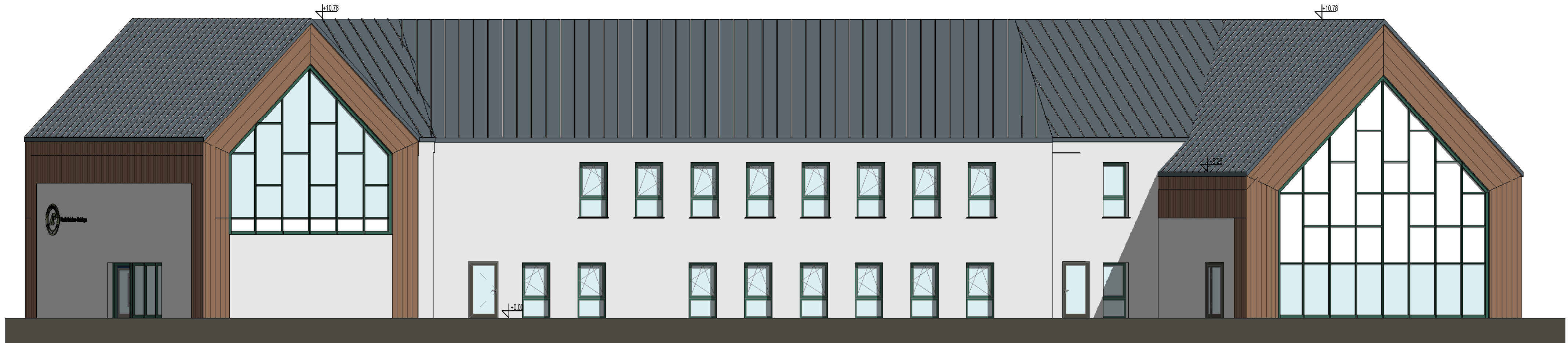
4 A - Elewacja zachodnia 1 : 100