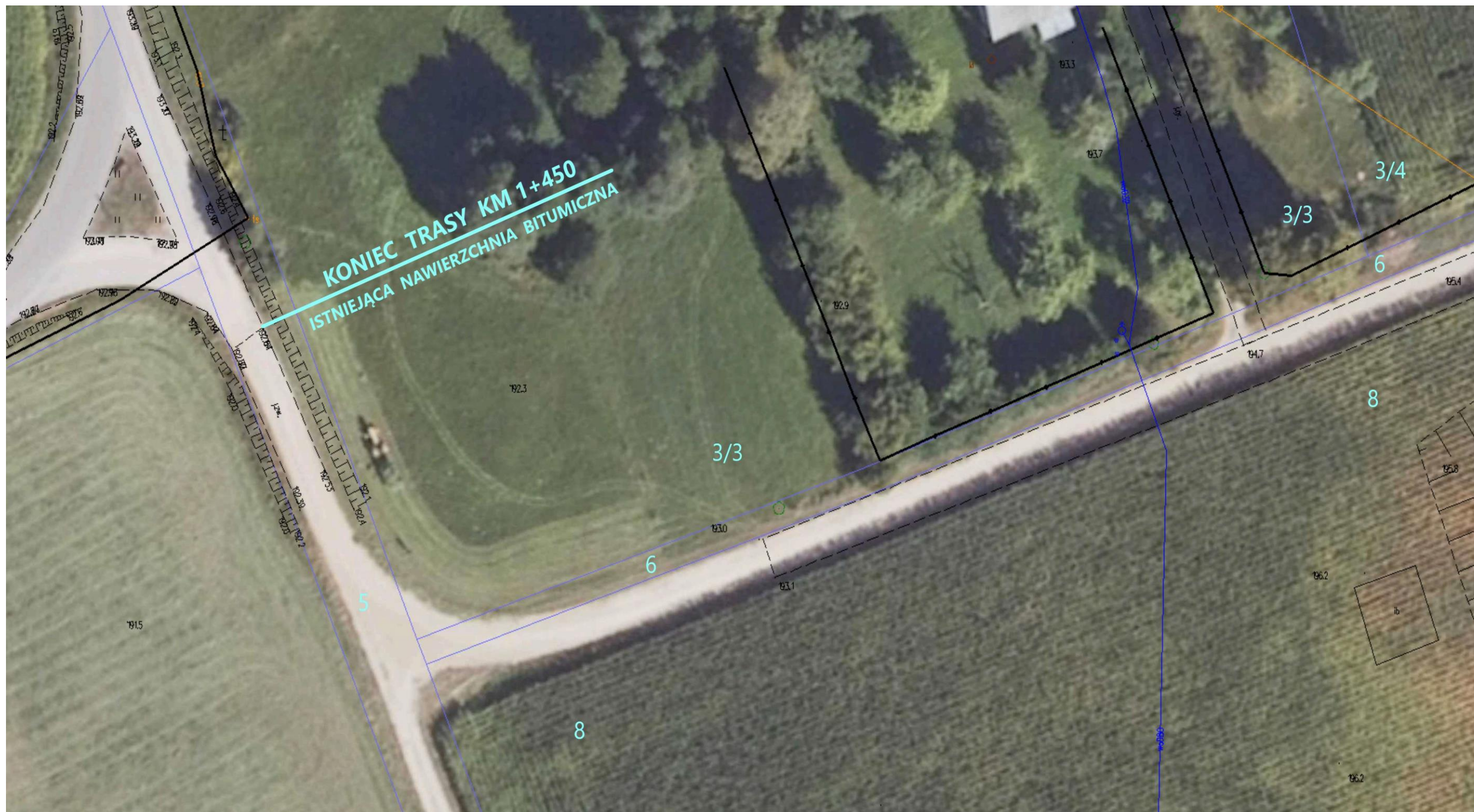
Ortofotomapa nr 9. Odcinek drogi gminnej nr 103601B Wólka – Romanówka. Kilometraż od 1+270 do 1+450.