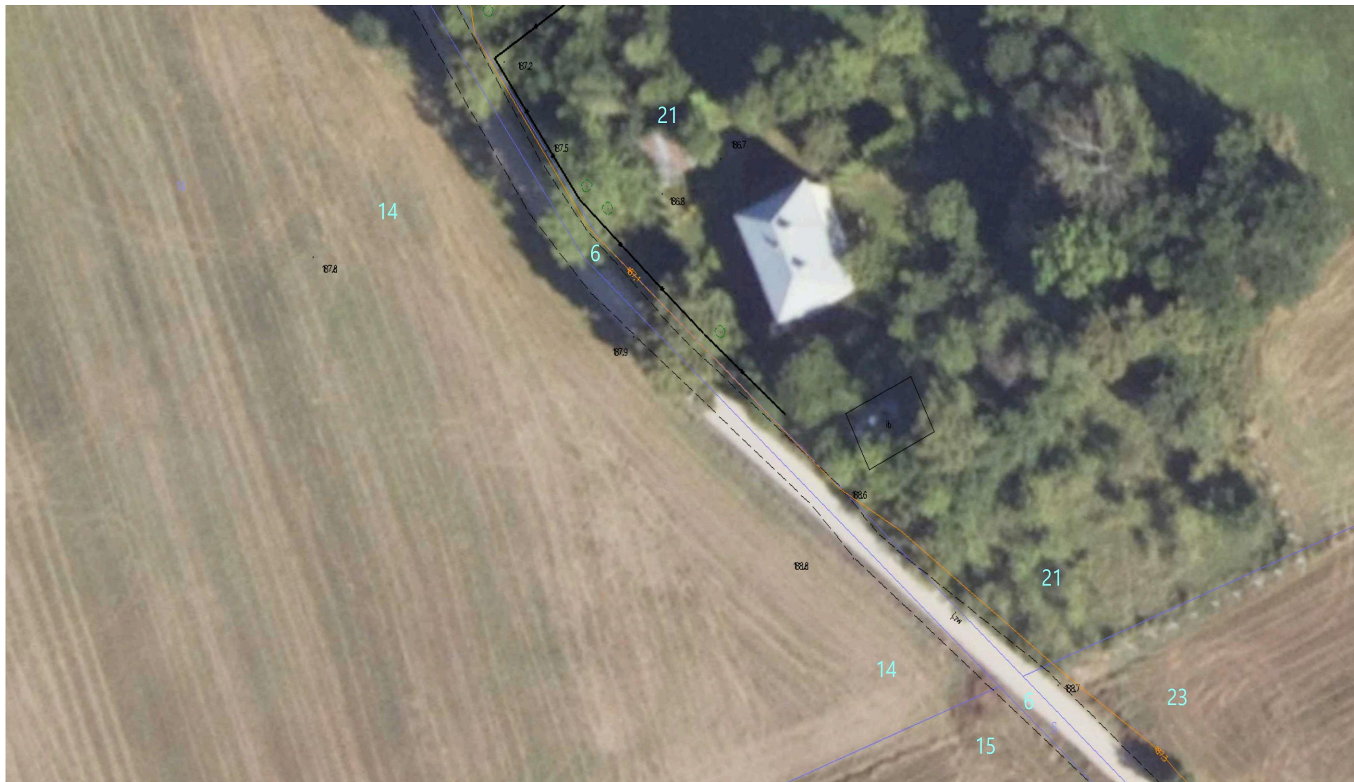
Ortofotomapa nr 5. Odcinek drogi gminnej nr 103601B Wólka – Romanówka. Kilometraż od 0+580 do 0+700