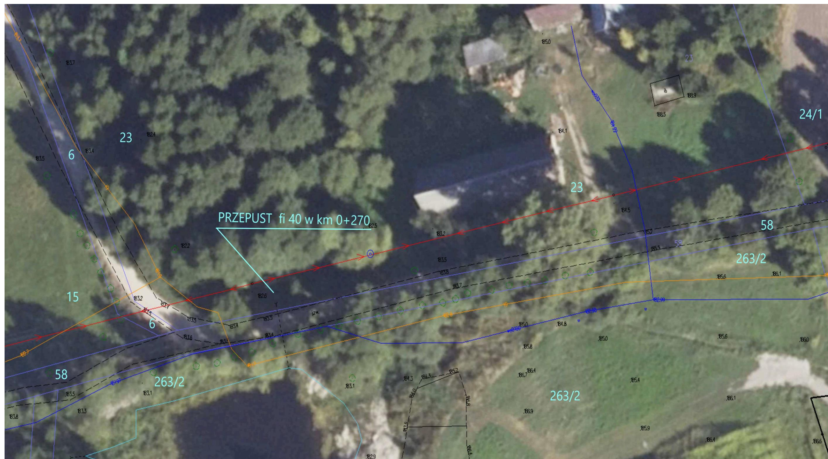
Ortofotomapa nr 2. Odcinek drogi gminnej nr 103601B Wólka – Romanówka. Kilometraż od 0+155 do 0+360