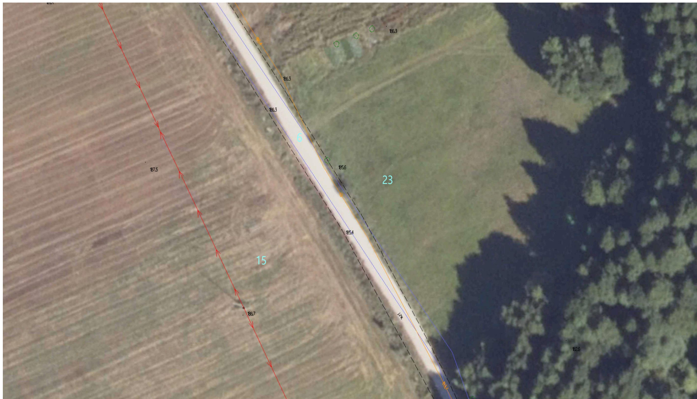
Ortofotomapa nr 3. Odcinek drogi gminnej nr 103601B Wólka – Romanówka. Kilometraż od 0+360 do 0+460