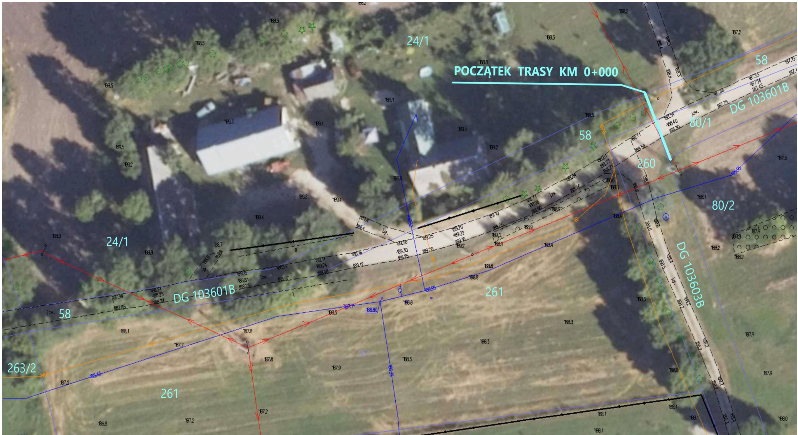
Ortofotomapa nr 1. Początek odcinka drogi gminnej nr 103601B Wólka – Romanówka. Skrzyżowanie z DG103603B. Kilometraż od 0+000 do 0+155