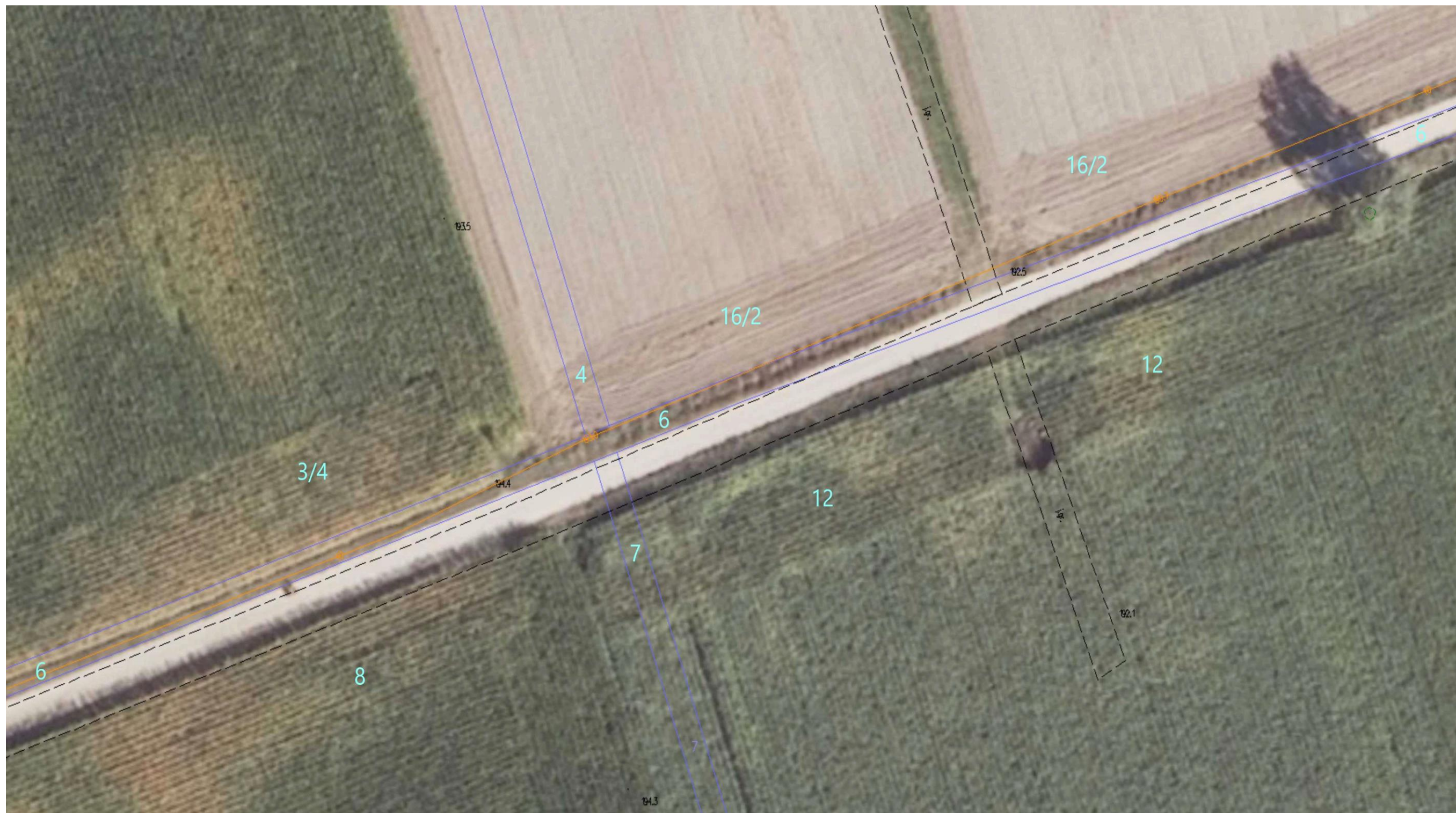
Ortofotomapa nr 7. Odcinek drogi gminnej nr 103601B Wólka – Romanówka. Kilometraż od 0+895 do 1+075