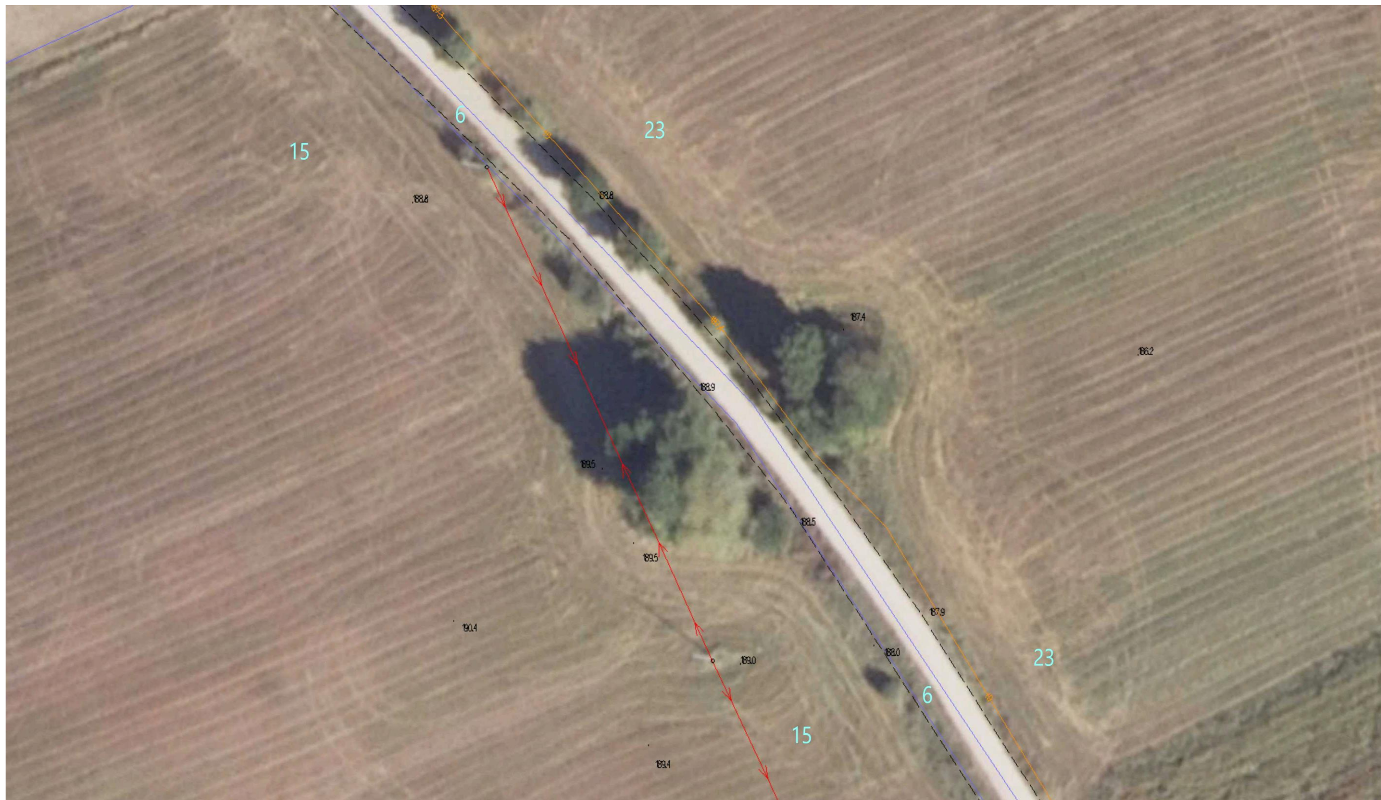
Ortofotomapa nr 4. Odcinek drogi gminnej nr 103601B Wólka – Romanówka. Kilometraż od 0+460 do 0+580