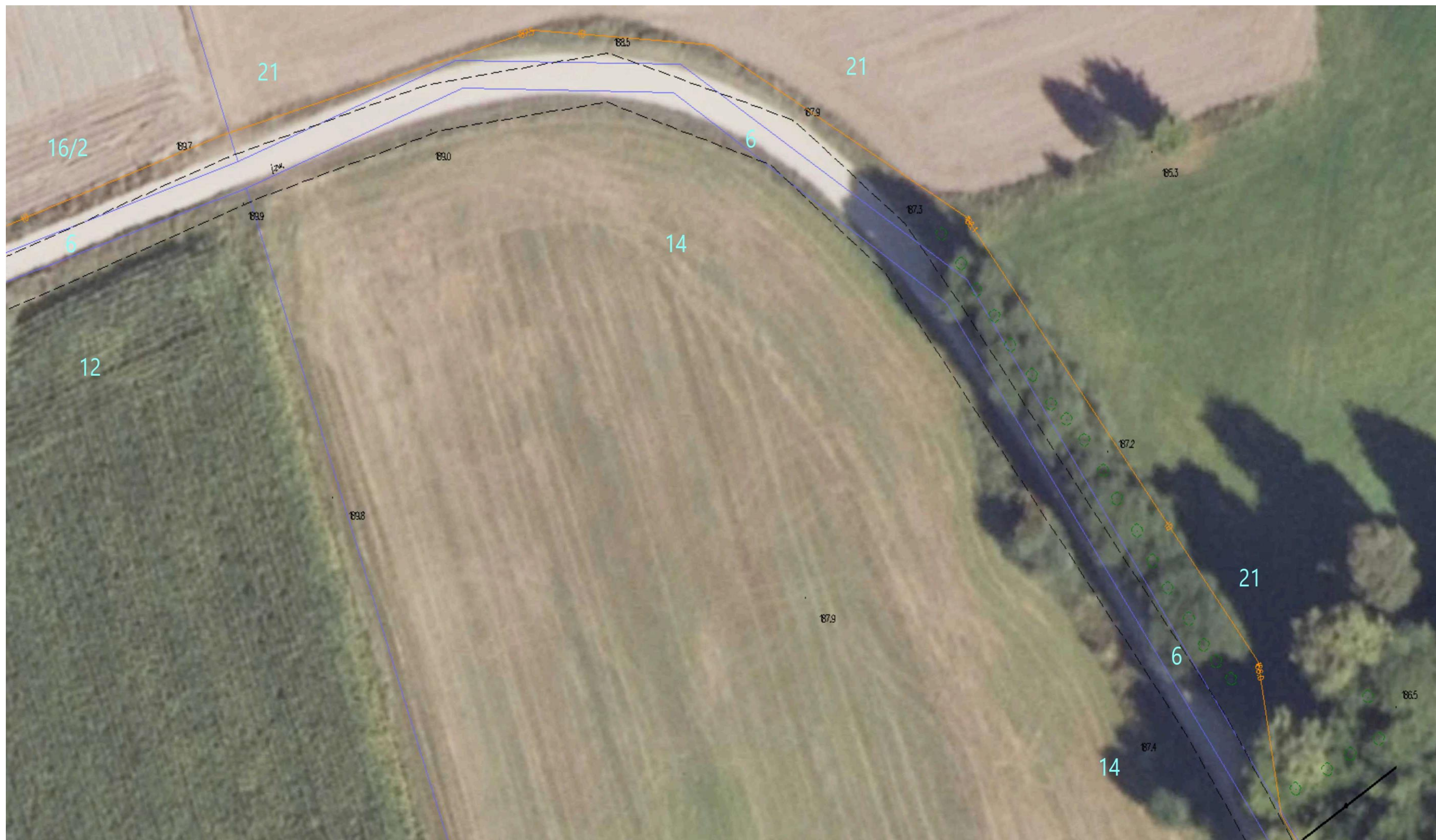
Ortofotomapa nr 6. Odcinek drogi gminnej nr 103601B Wólka – Romanówka. Kilometraż od 0+700 do 0+895