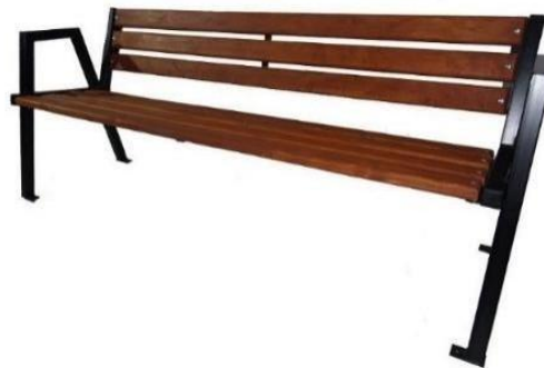
rys. 1 – Ławka parkowa