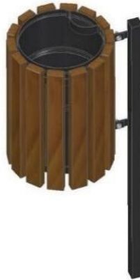
rys. 2 – Kosz na śmieci