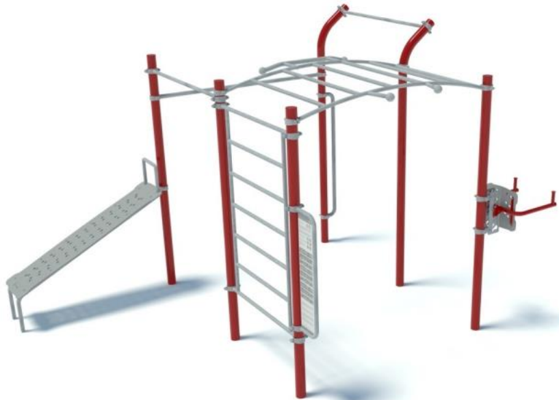
rys. 2 – Urządzenia do ćwiczeń

https://starmax.com.pl/files/page_files/276/karta-katalogowa-s11-zestaw-flaga.pdf