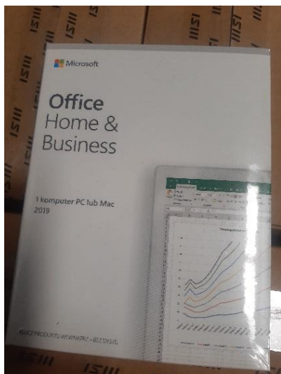
Rys. 3 Przykładowe zdjęcie pudełka dla produktu Microsoft Home&Business

Jesteśmy przekonani , że dzięki takiemu zapisowi do wzoru umowy Zamawiający otrzyma od potencjalnego Wykonawcy w pełni oryginalne oprogramowanie zgodne z warunkami licencjonowania producenta oprogramowania.