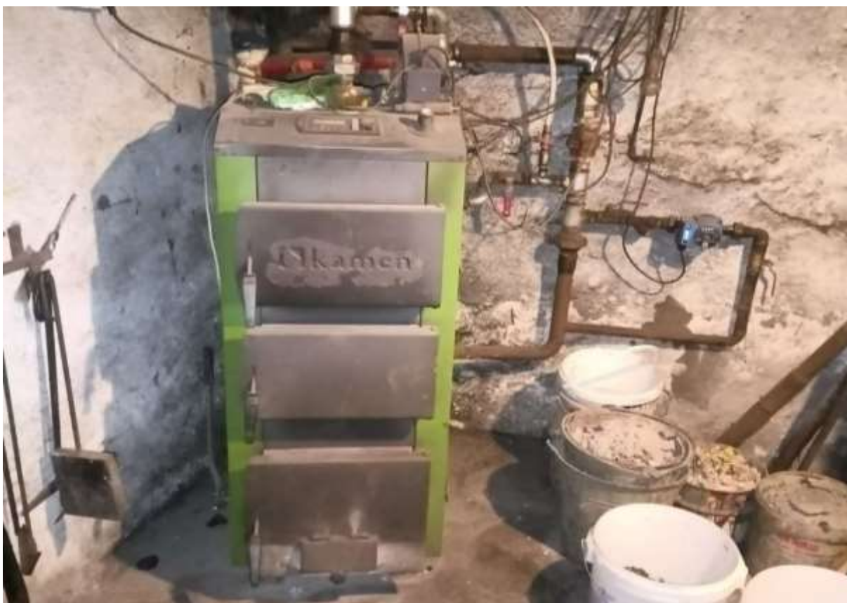
Rysunek 4 Zakres modernizacji - wymiana źródła ciepła wraz z modernizacją instalacji