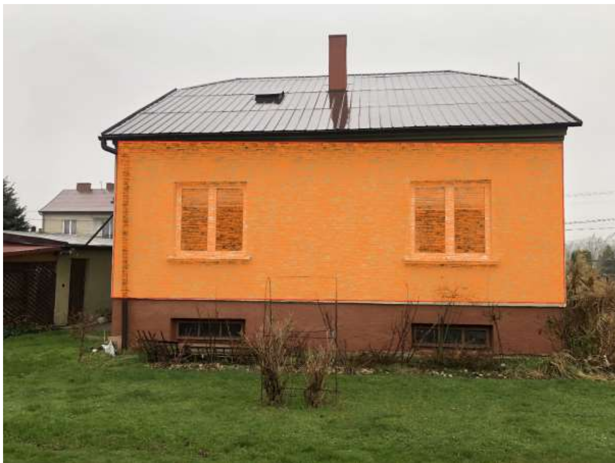
Rysunek 3 Zakres modernizacji - ściana (elewacja południowa)