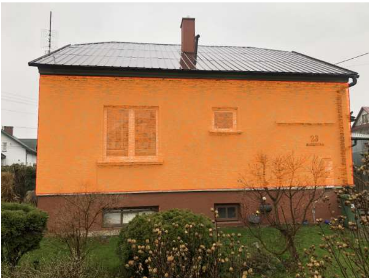
Rysunek 2 Zakres modernizacji - ściana (elewacja północna)