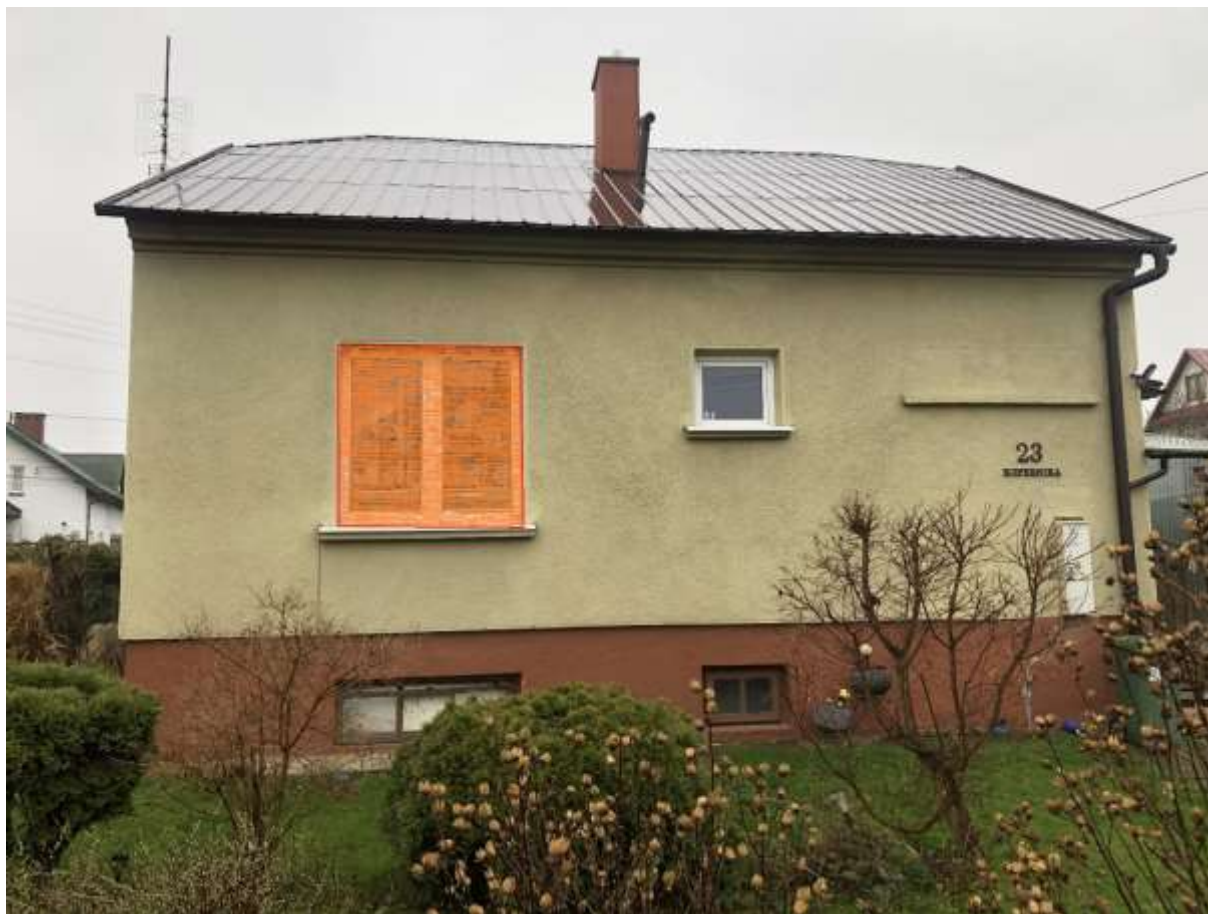
Rysunek 1 Zakres modernizacji - wymiana okna (ściana północna)