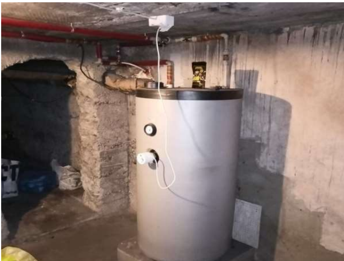
Rysunek 3 Zakres modernizacji - wymiana źródła ciepła wraz z modernizacją instalacji