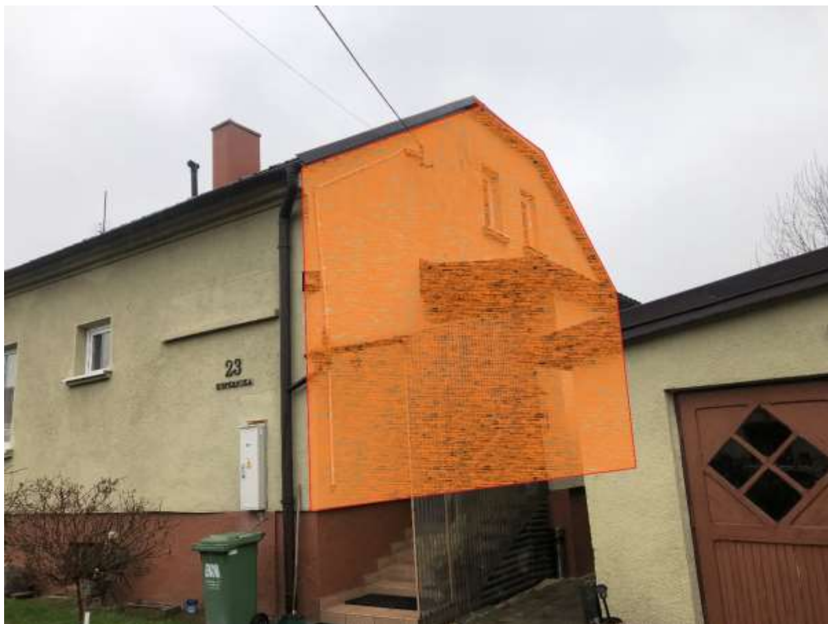
Rysunek 5 Zakres modernizacji - ściana (elewacja zachodnia)