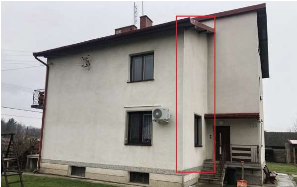
Rysunek 1 Zakres modernizacji - docieplenie ścian zewnętrznych (ściana północna)