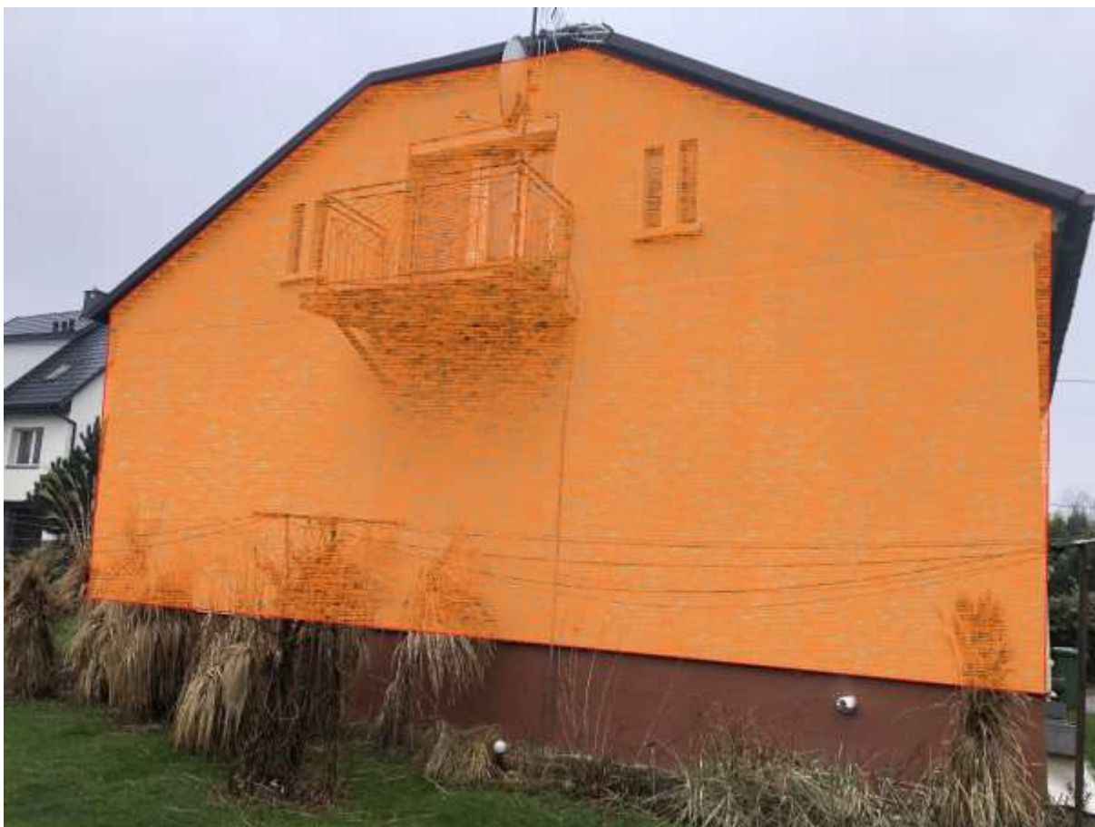
Rysunek 4 Zakres modernizacji - ściana (elewacja wschodnia)