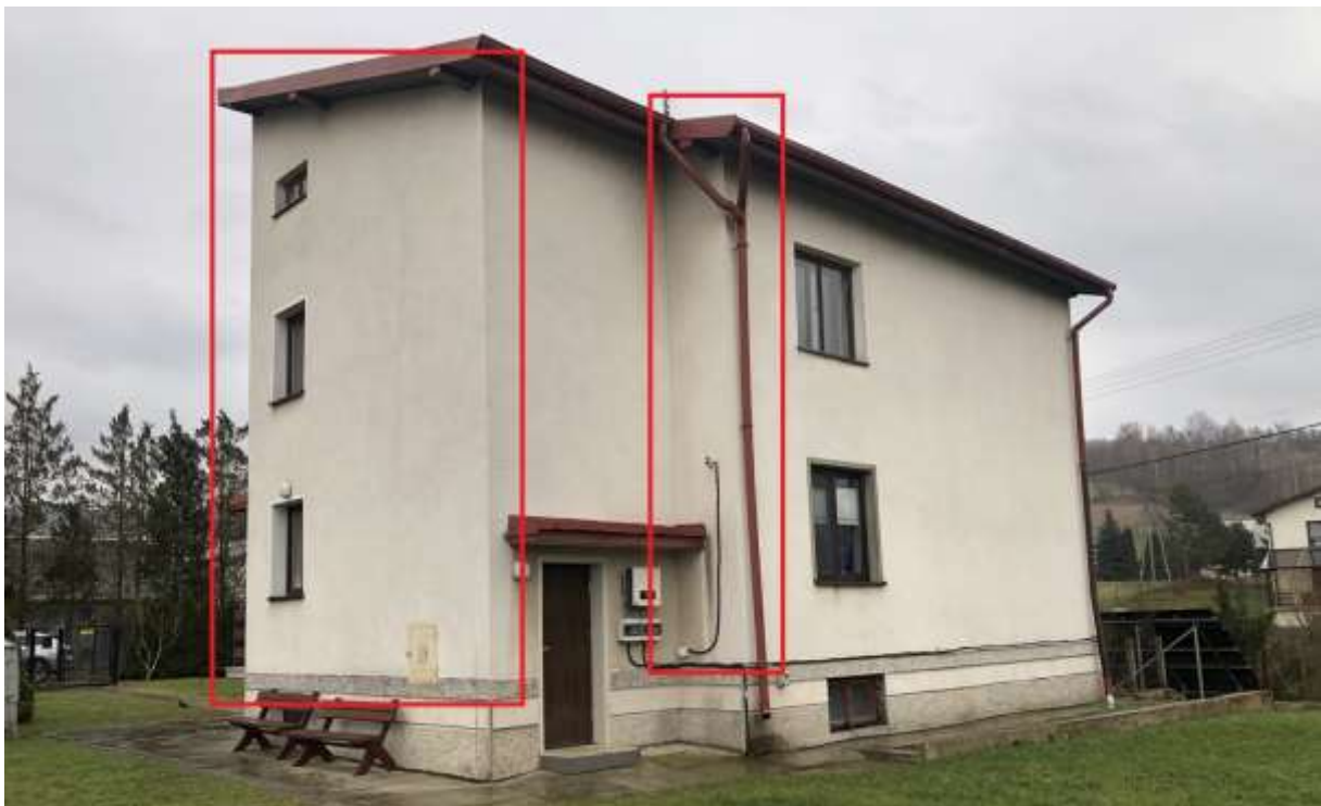
Rysunek 2 Zakres modernizacji - docieplenie ścian zewnętrznych (ściana północna)