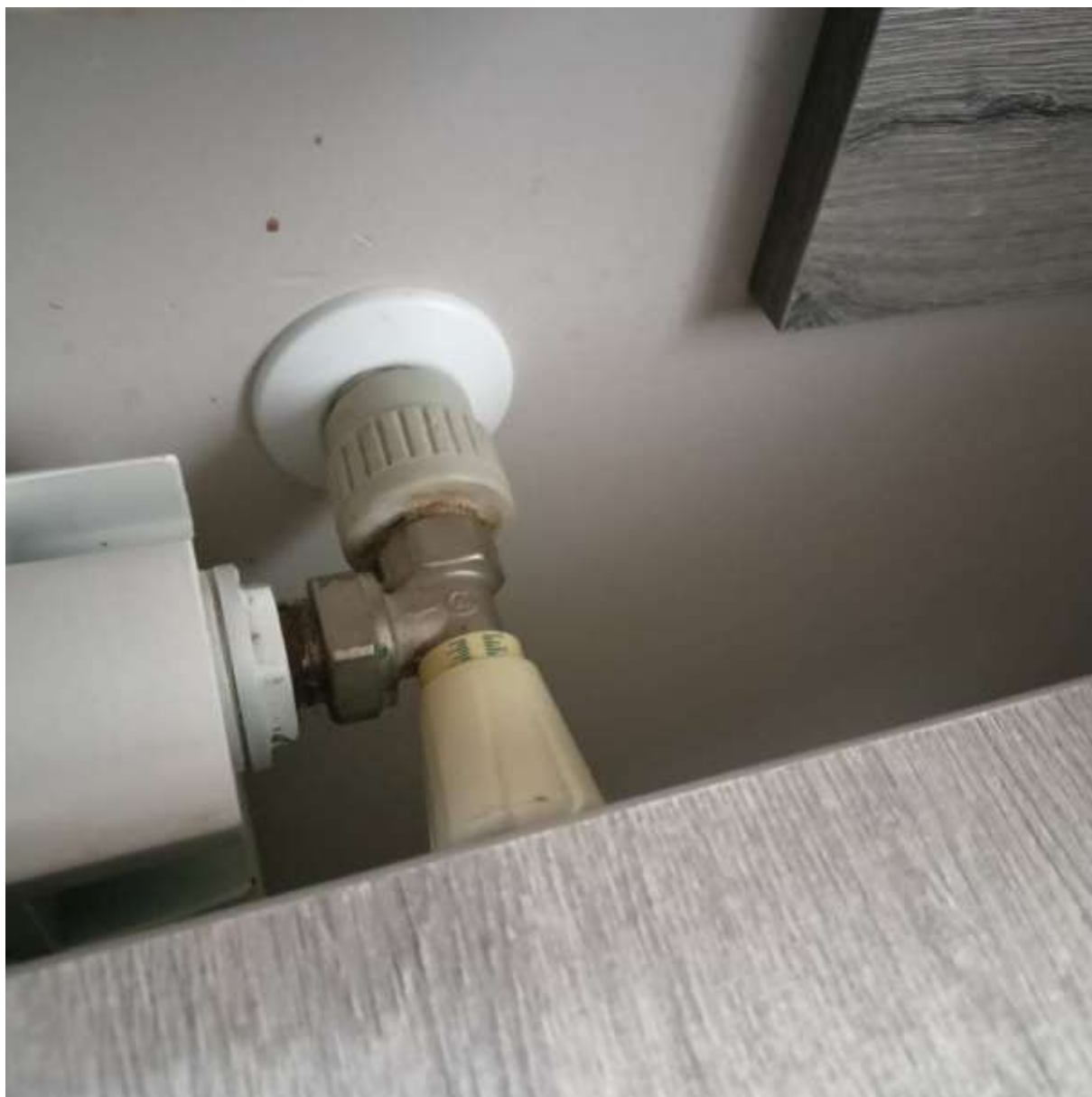
Rysunek 5 Zakres modernizacji - wymiana źródła ciepła wraz z modernizacją instalacji (montaż termostatów)