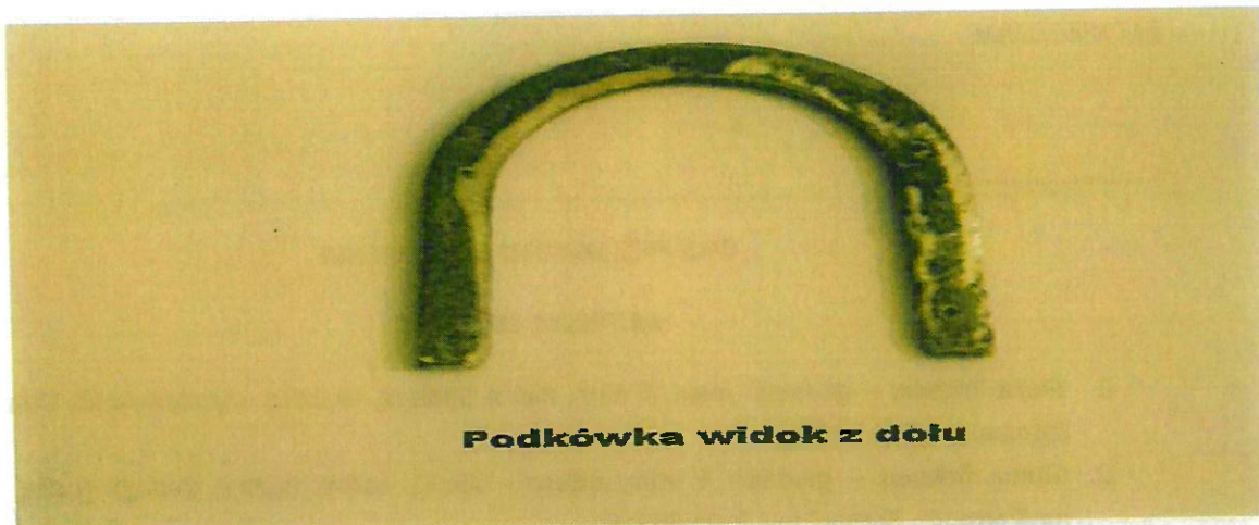
Podkówka widok z dołu