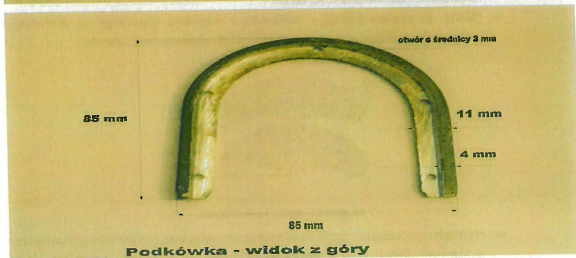
Podkówka - widok z góry