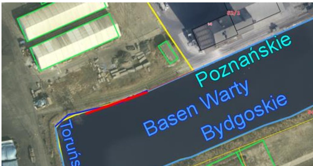
Rys. Zakres przeglądu nb. Poznańskiego (55m)