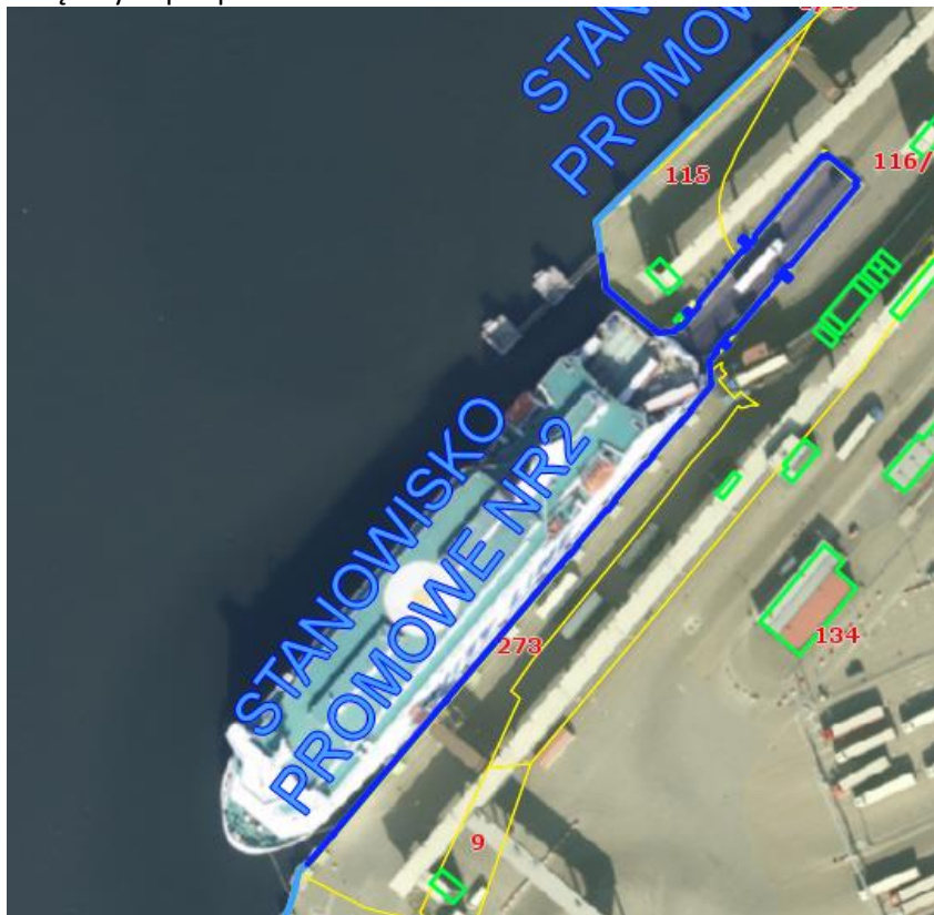
Rys. Zakres badań Stanowiska Promowego nr 2

Żelbetowa, dwuprzęsłowa płyta zespolona (prefabrykaty teowe + nadbeton), o grubości w przęsłach ok. 60 cm, i szerokości całkowitej 13,3 m, oparta jest na trzech, monolitycznie z nią związanych podporach.