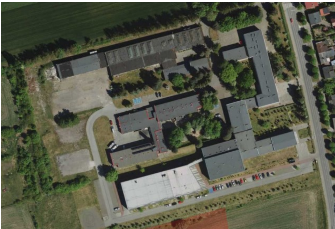
Widok ogólny kompleksu szkolnego

Celem przedsięwzięcia jest przeciwdziałanie niszczeniu oraz degradacji obiektu, a także poprawa warunków świadczonych usług oświatowych przez powiat radziejowski. Z uwagi na funkcję obiektu oraz jego centralne usytuowanie w miejscowości, powinien on swoją formą zewnętrzną i wewnętrzną kształtować w uczniach poczucie estetyki, dobrego smaku i funkcjonalności. Natomiast dla mieszkańców powiatu, planowana inwestycja powinna znacząco wpłynąć na poprawę życia mieszkańców, uczniów i ich rodzin z terenów byłych PGR w zakresie podjęcia edukacji.