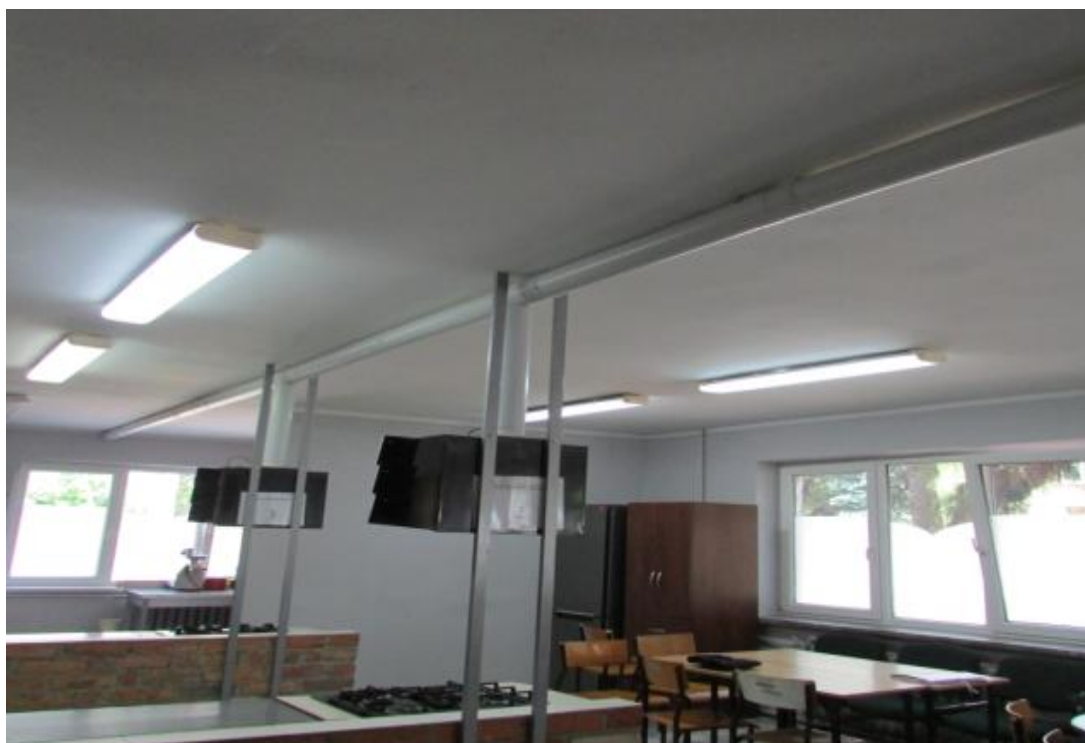
Fot. 8 Pracownia gastronomiczna– pom. nr 0/3