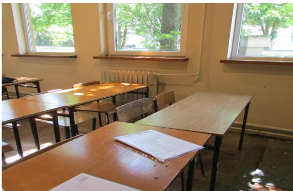
Fot. 2 Instalacja c.o z grzejnikami do wymiany – sala nr 0/10