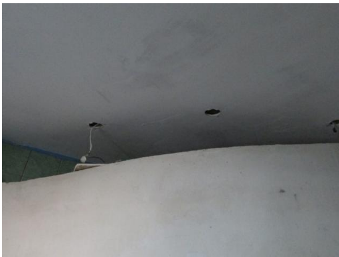
Fot. 4 Pomieszczenie sanitarne – pom. nr 0/12