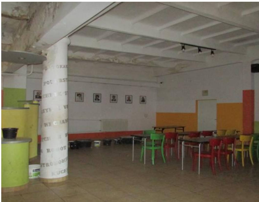
Fot. 7 Pomieszczenie świetlicy– pom. nr 0/30