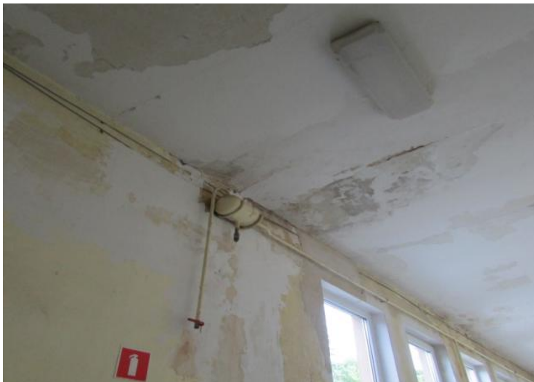
Fot. 3 Korytarz do remontu – pom. nr 0/15