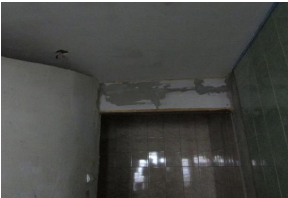
Fot. 5 Pomieszczenie sanitarne– pom. nr 0/12