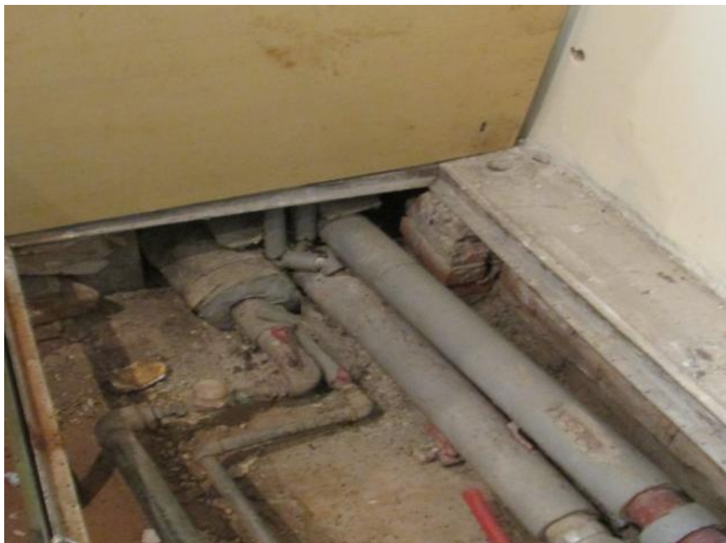
Fot. 1 Przyłącze c.o. i c.w.u. do budynku – sala nr 0/10