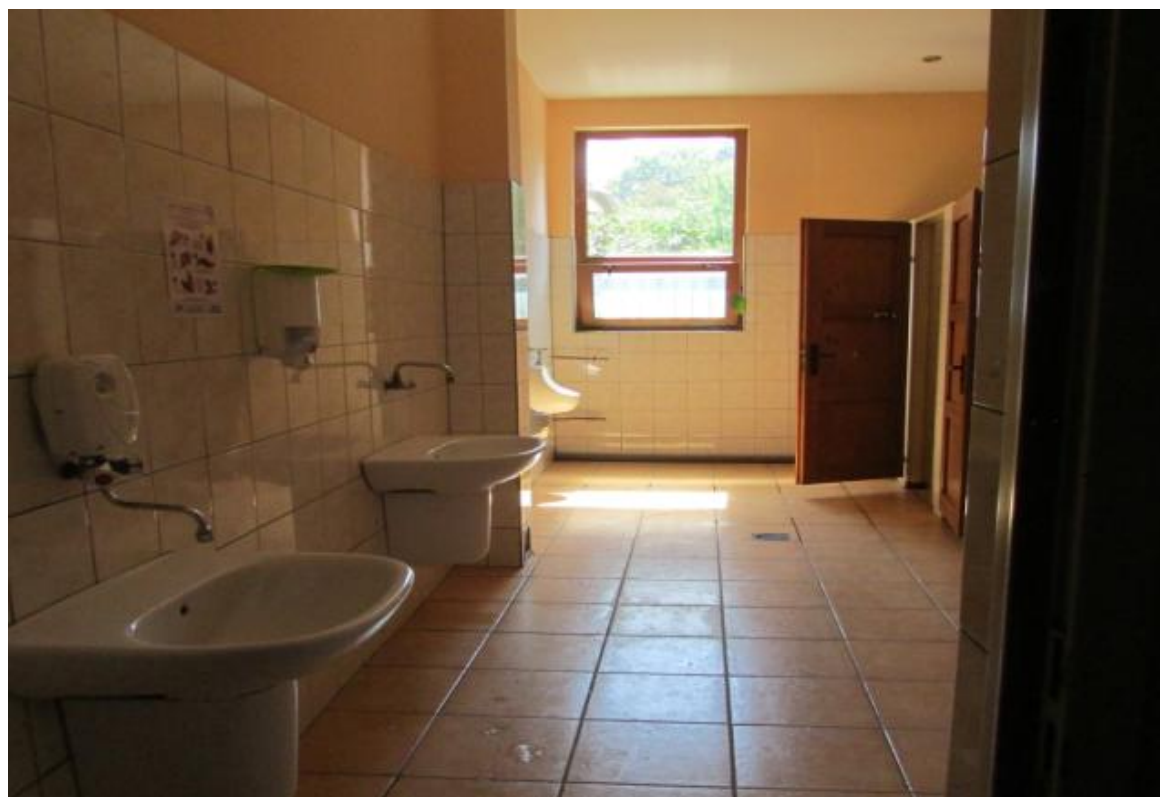
Fot. 10 Toalety – pom. nr 0/18