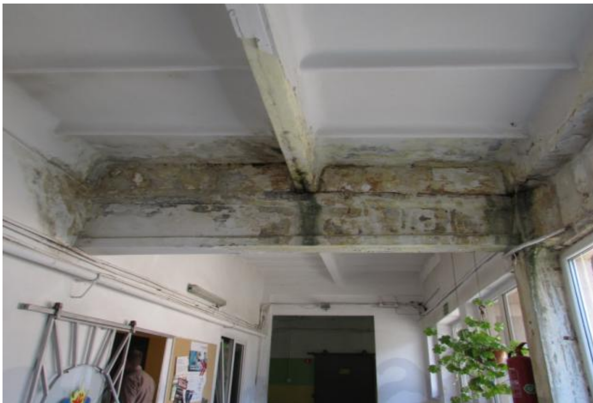
Fot. 9 Korytarz – pom. nr 0/28